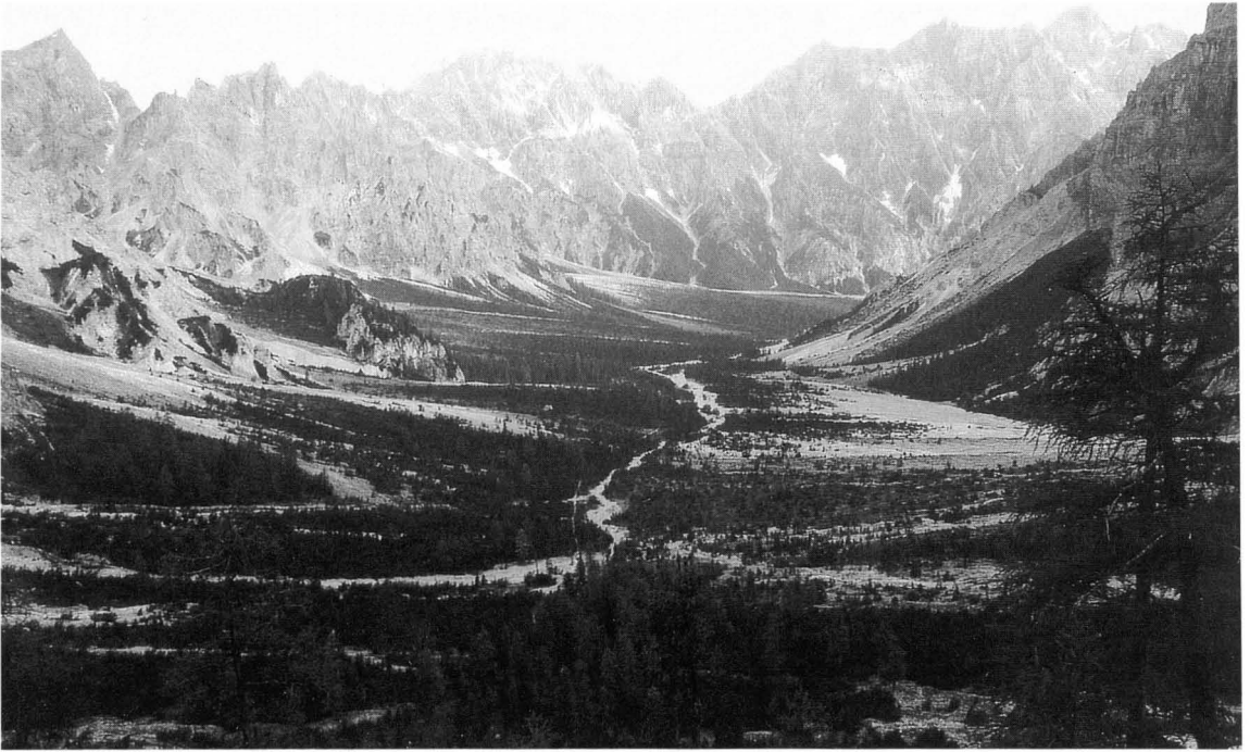
Abb. 1: Blick vom Trischübel über den südlichen Teil des Wimbachtales.