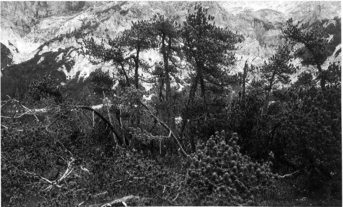
Abb. 2: Aufrechte und kriechende Formen der Berg-Kiefer ( Pinus mugo ) im Wimbachgries.