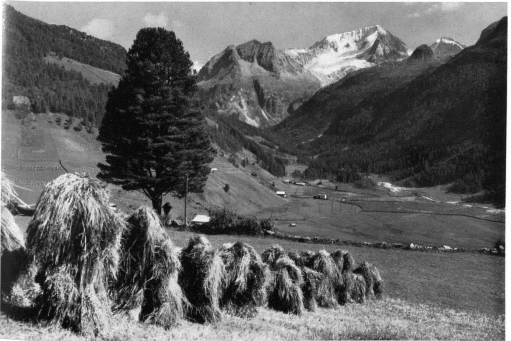
Abb. 2 Der Abschluß des Raintals in der Rieserfernergruppe (Hohe Tauern, Südtirol), vom Dorfe Rain aus gesehen. Rechts über der Bildmitte der Hochgall (3440 m), der höchste Gipfel der Rieserfernergruppe; rechts unter ihm, in die Lücke der hohen Gipfel aufragend, das Tristenköckel (2469 m), auf dessen Gipfel das oberste Zirbenwäldchen der Ostalpen liegt; auf der sanften Abdachung links unter dem Nöckel, fast in der Falllinie unter dem Hochgallgipfel, ist die Alte Kasseler Hütte sichtbar. Im Vordergrund links eine sehr tief (1580 m) gelegene Einzelzirbe, die das Kreuz unter ihr schirmt (Kultbaum?)