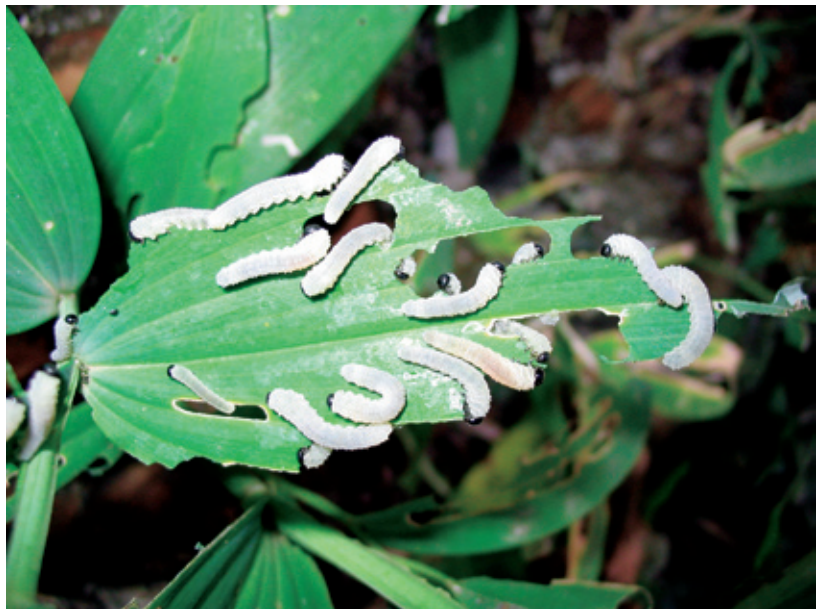
Abb. 14-15: Phymatocera aterrima : Larven fressend an Salomonssiegel, 01.07.2006