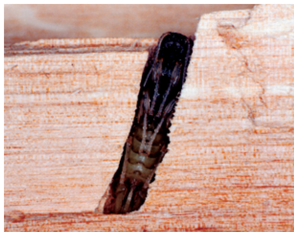
Abb. 34: Schwertwespe: Xyphidria camelus Puppe im Fraßgang: Vahrn, 21.05.2005