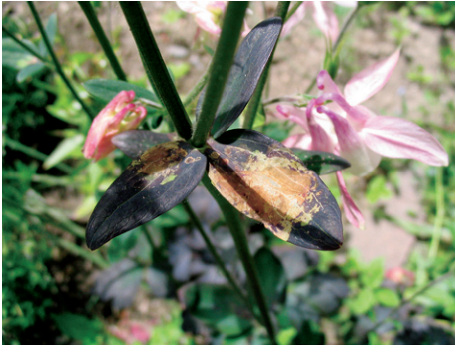
Abb. 13: Akelei-Minierfliege, Blattminen an Aquilegia, Brixen-Milland: 26.05.2006