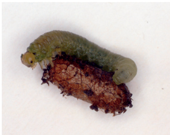
Abb. 10: Akelei-Blattwespe: Kokon mit Larve: Brixen, 15.04.2005