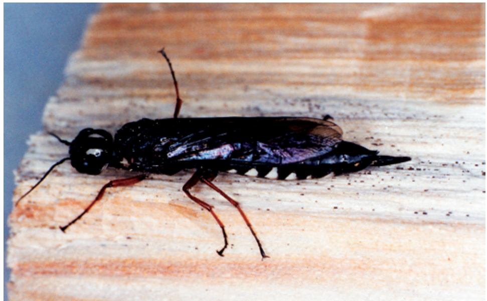
Abb. 35: Schwertwespe: Xiphydria camelus ♀; Aus Birke: Vahrn, 29.05.2005