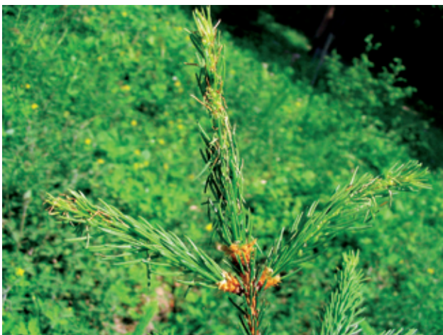
Abb. 23: Pristiphora abietina , Larvenfraß: Kaltern 12.05.2005