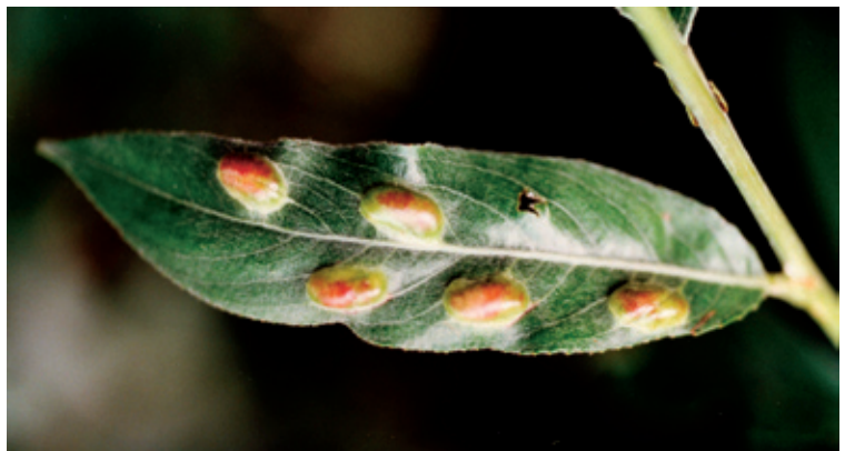
Abb. 8: Pontania proxima : Salix alba , Staben, 24.07.2001