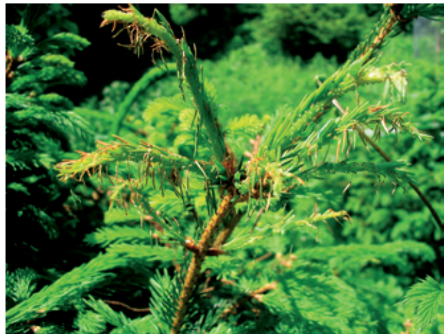
Abb. 22a,b: Pristiphora abietina , Schadbild: Kaltern 28.04.2005