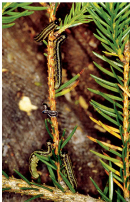
Abb. 25: Pachynematus insignis , Larvenkolonie, Mittewald: 29.06.1988

Es wurde gleich erkannt, dass es sich um einen außergewöhnlichen Fund handelte, weshalb noch vor Ort eine erste Fotodokumentation der Larvenkolonie erfolgte (Abb. 25). Weitere Makrofotos der eingetragenen Larven wurden am 03.07. und 05.07.1988