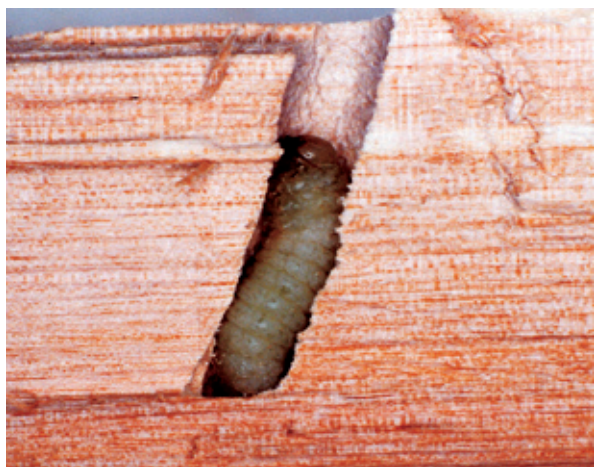
Abb. 33: Schwertwespe: Xyphidria camelus Larve im Fraßgang: Vahrn, 07.05.2005

An Parasitoiden fand sich eine Schlupfwespenart ( Rhysella approximator F.) in 4 Exemplaren (2 ♂, 2 ♀); durch ihre deutlich kleineren Fluglöcher (D=ca.2mm) als die der Holzwespen (D=ca. 4mm) ergab eine Zählung der Ausbohrlöcher an den Birkenprügeln, dass auf 32 Holzwespen etwa 12 Schlupfwespen (Ichneumonidae) entfielen (Parasitierung ca. 27%).