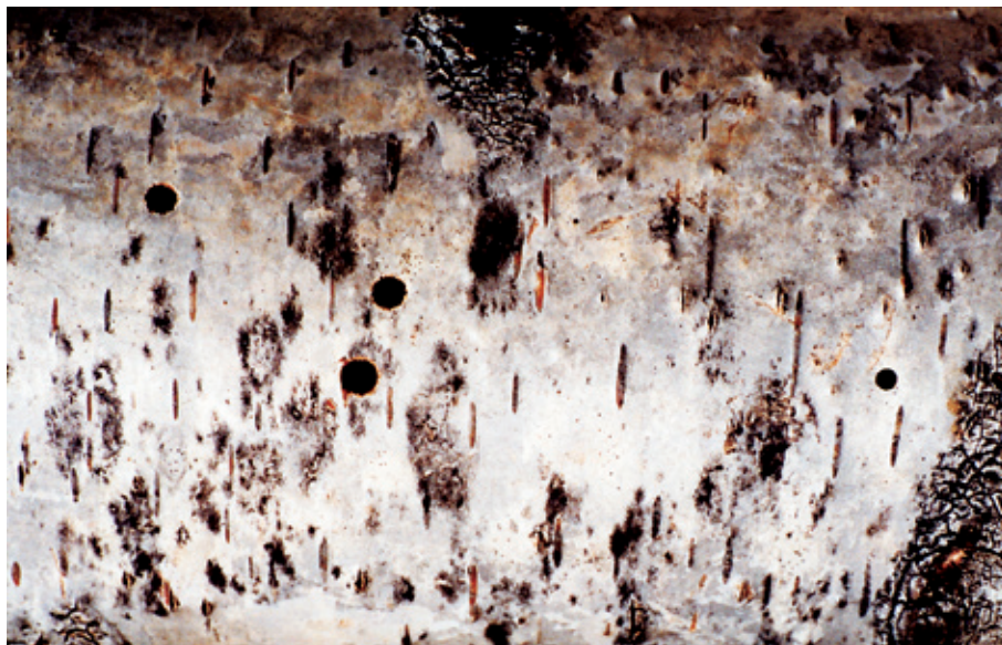
Abb. 32: Schwertwespe: Xiphydria camelus Fluglöcher in Birke: Vahrn, 2004/05