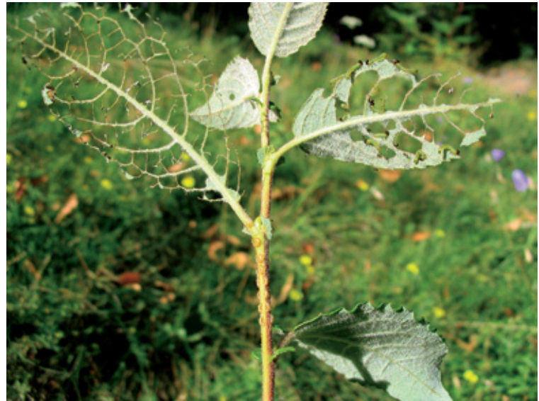
Abb. 2: Craesus septentrionalis : an Salweide Einischen und Junglarven: Vahrn, 10.09.2006