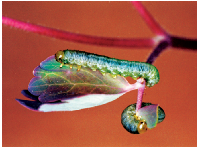
Abb. 11: Akelei-Blattwespe: Larve fressend: Brixen, 27.04.2005