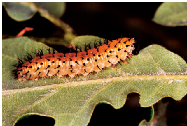
Abb. 21: Periclista lineolata Larve (makro): Neustift, 20.05.2006