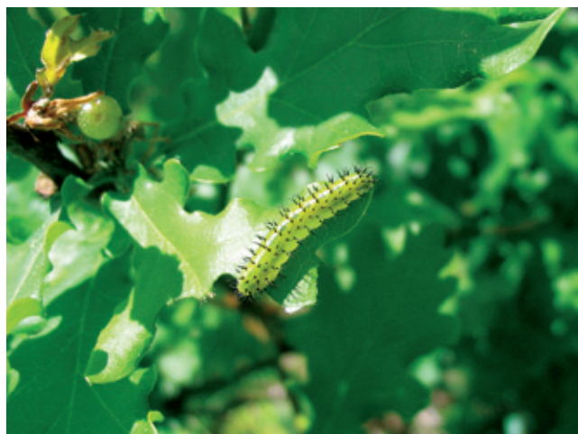
Abb. 19: Periclista : Larvenfraß an Eichen, Neustift, 17.05.2006

Gesammelte Larven wurden in ein großes Zuchtglas gegeben, mit Eichenblättern und Erdschicht am Boden. Einige getrennt gehaltene Larven, mit wenig Futterblättern, verübten Skelettierfraß (Abb. 20). Am (20)-22.05.2006 wurden die ersten Einspinnlarven von Periclista beobachtet und bis 24.05.2006 hatten sich alle Larven bereits in den Boden zur Kokonbildung eingebohr. Das mit einem Drahtgitter verschlossen Zuchtglas wurde die ganze Saison über im Freien gehalten, doch es schlüpfen erwartungsgemäß keine Blattwespen. – Überwinterung erfolgt somit im Kokon im Boden.