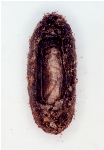
Abb. 30: Weidenblattwespe: Nematus salicis Kokon (parasitiert): 20.09.2005, Brixen