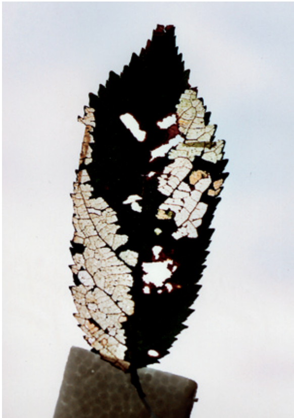
Abb. 1: Calliroa cerasi : Skelettierfraß an Vogelkirsche, Vetzan 10.08.2006