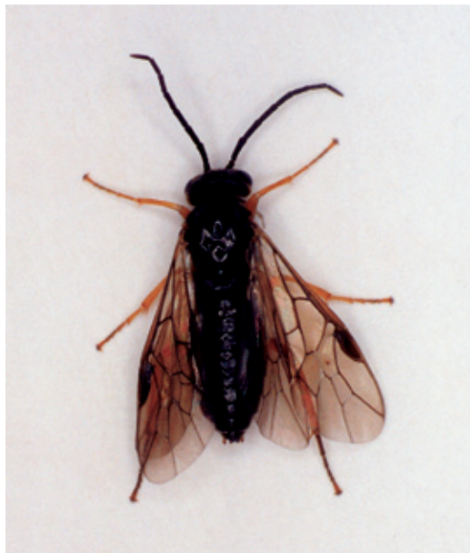
Abb. 9: Akelei-Blattwespe: Brixen-Köstlan, Gärtnerei: 15.04.2005

Hausgarten an Aquilegia vulgaris Blattminen mit Larven der Minierfliege Phytomyza aquilegiae Hardy 1849 (Diptera: Agromyzidae) entdeckt und fotografiert (Abb. 13). – Auch diese Art ist ein Neufund für Südtirol und Erstmeldung für Italien .