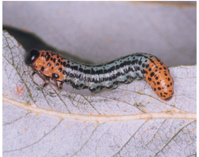
Abb. 28: Weidenblattwespe: Nematus salicis Larve: 20.10.2004, an Salix alba , Brixen