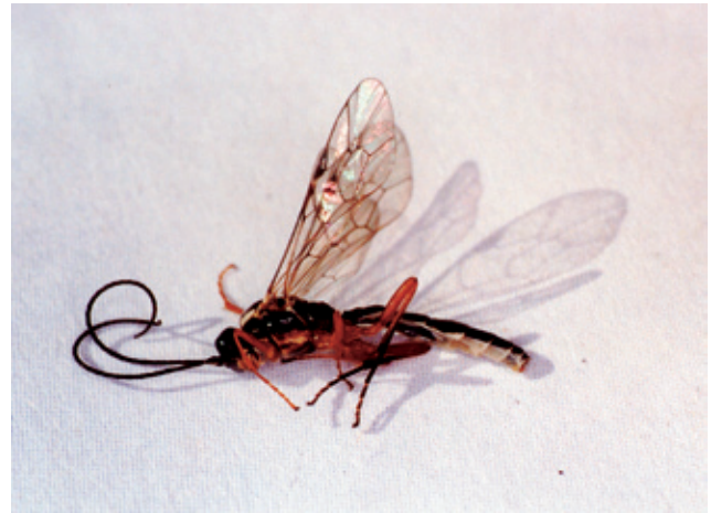
Abb. 31: Schlupfwespe aus Kokon von Nematus salicis : 06.10.2005, Brixen