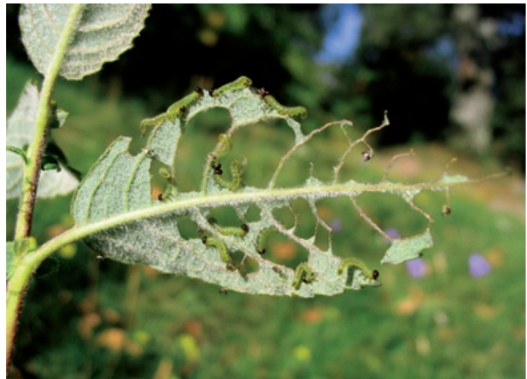
Abb. 3: Craesus septentrionalis : Skelettierfraß Junglarven an Salix caprea : Vahrn, 10.09.2006