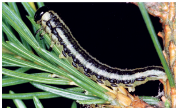
Abb. 26: Pachynematus insignis Altlarve: Mittewald, 05.07.1988