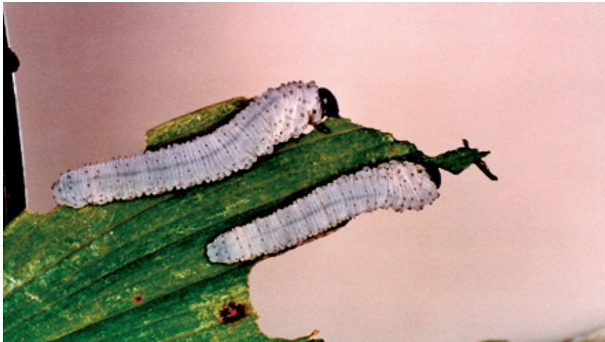
Abb. 16-17: Phymatocera aterrima : Altlarven an Polygonatum , Brixen, 10.07.2006