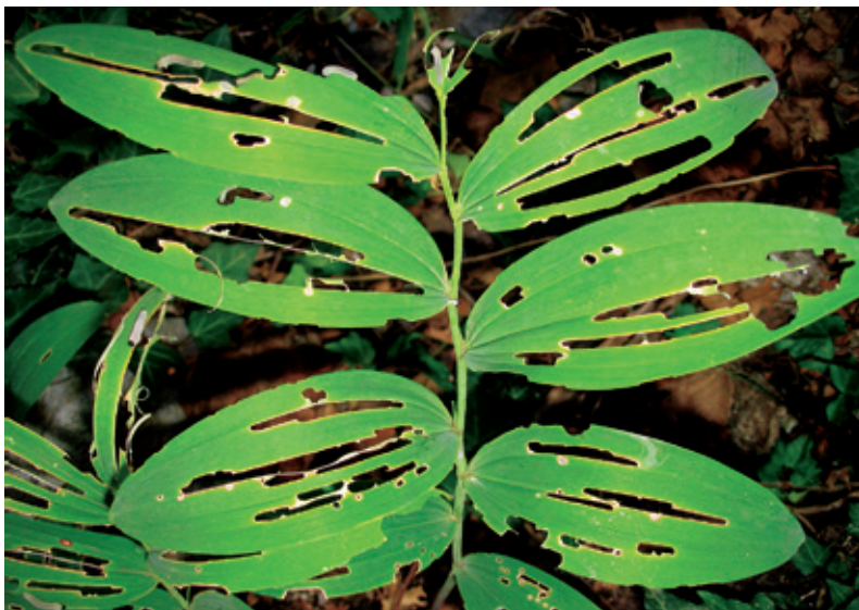
Abb. 18: Phymatocera aterrima : Blatt-Schlitzfraß an Salomonssiegel, 01.07.2006