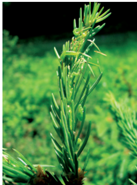
Abb. 24: Pristiphora abietina , Larvenfraß: Kaltern 12.05.2005