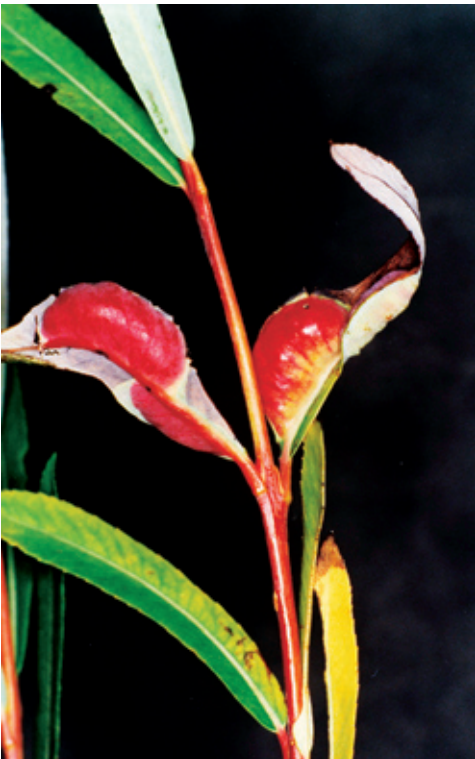
Abb. 7: Pontania vesicator : Salix purpurea , Klobenstein, VIII.2005