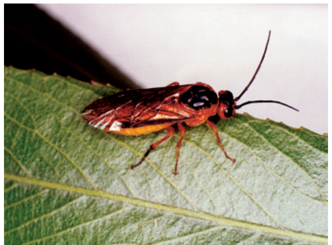
Abb. 29: Weidenblattwespe: Nematus salicis Imago (ex larva): 04.09.2005, Brixen