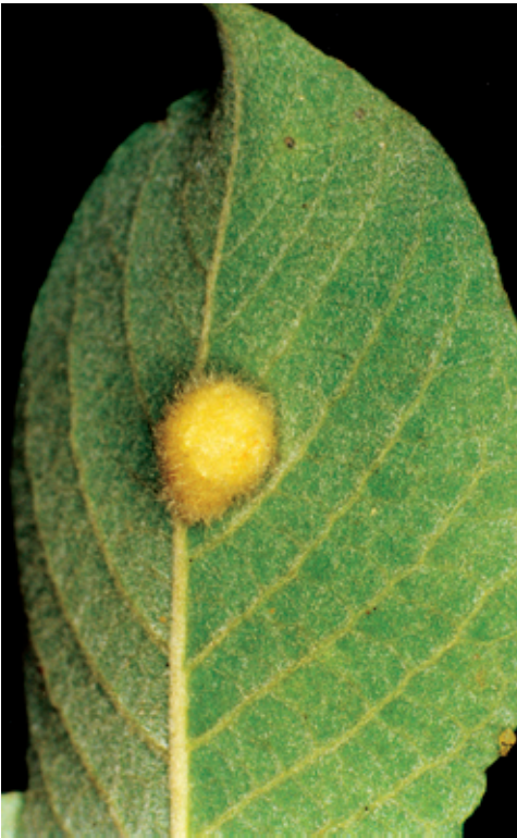
Abb. 5: Pontania gallarum : Salix caprea : Schabs, 750 m, 17.08.1999