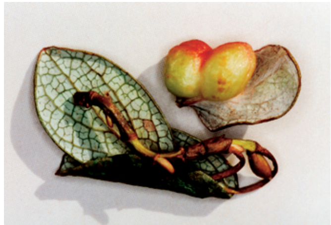
Abb. 6: Pontania reticulatae : Salix reticulata , Groß Fanes, 25.07.2001