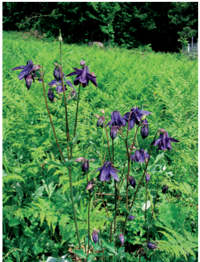
Abb. 12: Akeleibestand Freiland, im Montiggler Wald: 12.05.2005