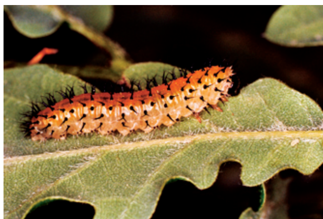
Abb. 21: Periclista lineolata Larve (makro): Neustift, 20.05.2006