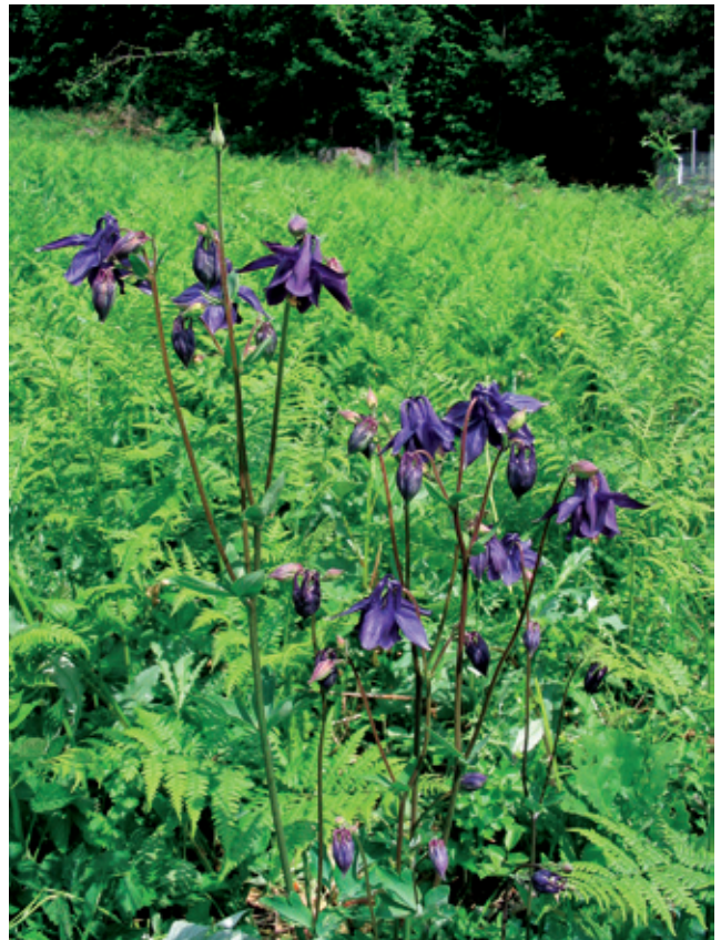
Abb. 12: Akeleibestand Freiland, im Montiggler Wald: 12.05.2005