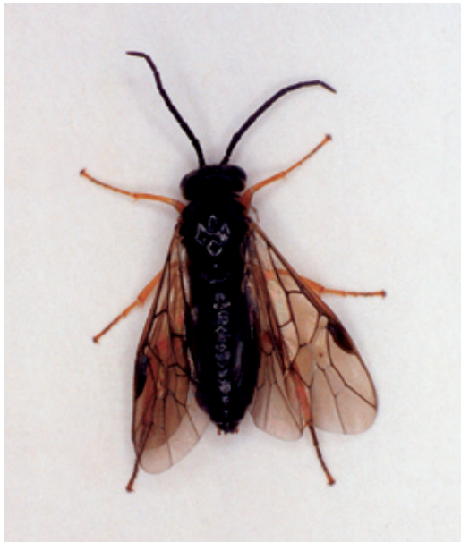
Abb. 9: Akelei-Blattwespe: Brixen-Köstlan, Gärtnerei: 15.04.2005