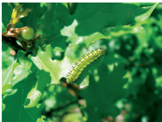
Abb. 19: Periclista : Larvenfraß an Eichen, Neustift, 17.05.2006

Gesammelte Larven wurden in ein großes Zuchtglas gegeben, mit Eichenblättern und Erdschicht am Boden. Einige getrennt gehaltene Larven, mit wenig Futterblättern, verübten Skelettierfraß (Abb. 20). Am (20)-22.05.2006 wurden die ersten Einspinnlarven von Periclista beobachtet und bis 24.05.2006 hatten sich alle Larven bereits in den Boden zur Kokonbildung eingebohrt. Das mit einem Drahtgitter verschlossen Zuchtglas wurde die ganze Saison über im Freien gehalten, doch es schlüpften erwartungsgemäß keine Blattwespen. – Überwinterung erfolgt somit im Kokon im Boden.