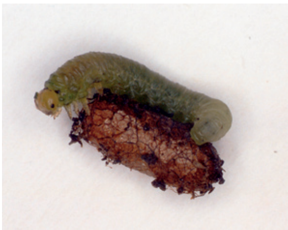
Abb. 10: Akelei-Blattwespe: Kokon mit Larve: Brixen, 15.04.2005