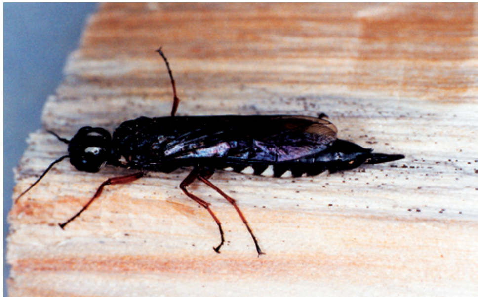
Abb. 35: Schwertwespe: Xiphidria camelus ♀; Aus Birke: Vahrn, 29.05.2005