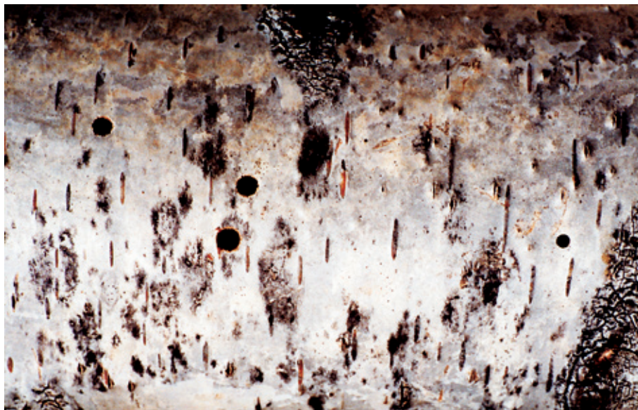
Abb. 32: Schwertwespe: Xiphydria camelus Fluglöcher in Birke: Vahrn, 2004/05

Wie immer nun N. glaphyropus Dalla Torre 1882 [Syn. = N. doebelii (Konow 1904)] künftig einzustufen sein mag, als eigene valide Art – oder als ssp. von N. wahlbergi (Thoms.), so bringt doch der rezente Larvenfund aus Südtirol / Campill eine wesentliche Erweiterung des Gesamtbildes. Zudem ist von weiteren Nachsuchen und Fundbelegen an den betreffenden Lonicera -Sträuchern in Campill künftig eine genauere Abklärung zu erwarten. Außer Frage steht, dass N. glaphyropus Dalla Torre 1882 gegenüber allen später beschriebenen Taxa Namenspriorität hat, sollten sich diese künftig als identisch herausstellen; hingegen wäre sie bei Einstufung als alpine Gebirgsrasse von N. wahlbergi Thoms. 1871 dieser als ssp. unterzuordnen.