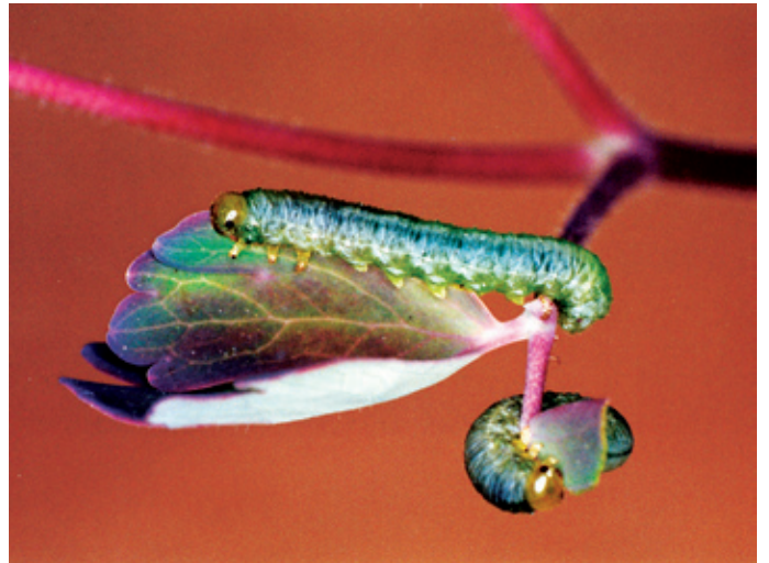
Abb. 11: Akelei-Blattwespe: Larve fressend: Brixen, 27.04.2005