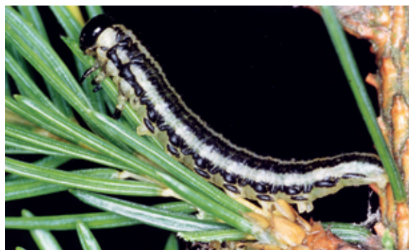
Abb. 26: Pachynematus insignis Altlarve: Mittewald, 05.07.1988