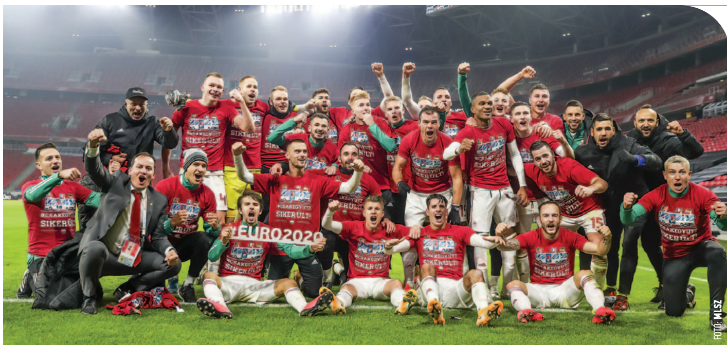
© Közös ünneplés az Izland elleni 2-1 után

bajnokság F csoportjának nem Magyarország a favoritja. Mindhárom ellenfél jóval magasabban jegyzett, és erősebb is. Reményt az öt évvel ezelőtti, Portugália ellen elért 3-3 jelenthet, valamint az a tény, hogy a szaksajtó szerint a német válogatott nem állt össze igazán. Ez persze csalóka kijelentés, de azért van benne valami: tavaly novemberben a Nationelf kapott egy 6-0-s leckét a spanyoloktól egy Nemzetek Ligája meccsen, és az Észak-Macedónia ellen 1-2-re elveszített idei vb-selejtezőt is nehéz megmagyarázni. A portugálok két utolsó veresége közül az egyik 2019-es, ekkor 2-1-re kaptak ki Eb-selejtezőn a csoportgyőztes ukránoktól. Van egy 2020-as 1-0-s zakójuk, NL-találkozón, hazai pályán veszítettek épp a franciák ellen – az odavágó 0-0 lett. A gallok az Eb-selejtezőket 5 pont veszteséggel tudták le, a törökök egyszer megverték őket, majd ikszeltek velük. Tavaly egyszer kaptak ki, a finnektől hazai pályán 2-0-ra, barátságos meccsen, ami persze nem ugyanaz, mint egy éles találkozó. Mindezek jelzik, hogy nem minden a papírforma, elvileg a magyar csapat is képes lehet egy meglepetés-eredményre – tegyük hozzá, ebben a mondatban azért komoly adag szurkolói bizodalom is van, mert amúgy elég ránézni a riválisok csapatnévsorára, és rögtön látható, hol tartanak hozzánk képest. Hogy sikerül-e valamelyik „nagyot” megtépázni (ha egyáltalán) a három közül, az kiderül a csoportmeccseken.