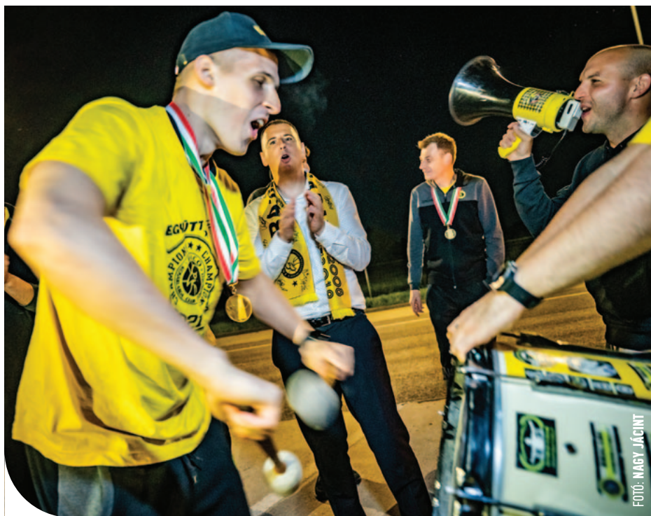
☉ A csapat a ceglédi benzinkúton is ünnepelt a szurkolókkal

– Valóban méltatlan helyzetet teremtett a finálé után, úgy fogalmaznék, nem volt a legjobb idegállapotban. Korábbi hagyomány szerint a győztes csapat városának polgármestere adhatja át az érmeket, így volt ez 2019-ben is, amikor Körmenten lett bajnok a Falco. Szalay Ferenc ezt most nem engedte, sőt, biztonsági öröket akart hívni, minősíthetetlen hangnemben beszélt a szombathelyiekről. A szurkolók is észrevették ezt, viszont nem akartam, hogy az ünneplés helyett ez legyen a téma, ezért elengedtem, mindenesetre szinten aluli volt az egész történet. Utána a Facebook-oldalán azért a csapat megemlézése nélkül gratulált a győztes csapatnak, de házigazdaként és a szövetség vezetőjeként is elég különösen viselkedett. De az örömmel nem tudta elrontani, hazafele Cegléden én is