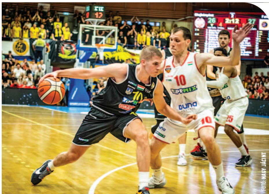
© Várad Benedek akcióban az ötödik mérkőzésen

– A play-offot a 2. helyen kezdtétek, nyomban a megyei rivális ellen. A Falco-Körmend találkozó mindig pikáns – ezúttal viszont nem