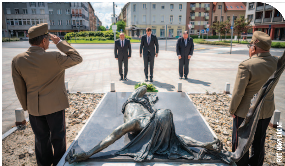
☉ A Március 15. téren is emlékezett a város a hősökre