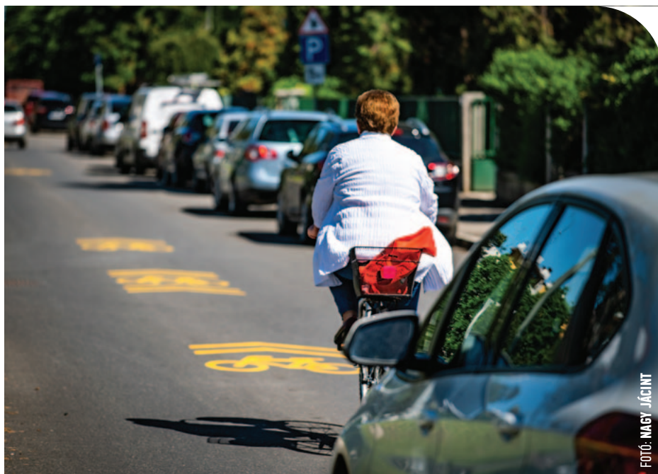
☉ A kerékpáros nyom nem bicikliút, csak lehetőség

A szombathelyi kerékpáros közlekedés fejlesztése részben biciklisávok és nyomok kijelöléséből, illetve felfestéséből állt az elmúlt években, de kerékpárutak is épültek. A legutóbbi (2016-os, az előző városvezetés alatt elindított) nagyobb lélegzetű beruházásorozatban több mint egymilliárdos pályázati forrásból 13 helyszínen történt közlekedési fejlesztés – a munkálatok tavaly kezdődtek meg. Kijelölnek 11 új kerékpáros útvonalat, de ugyanebben a projektben készült el a Nárai