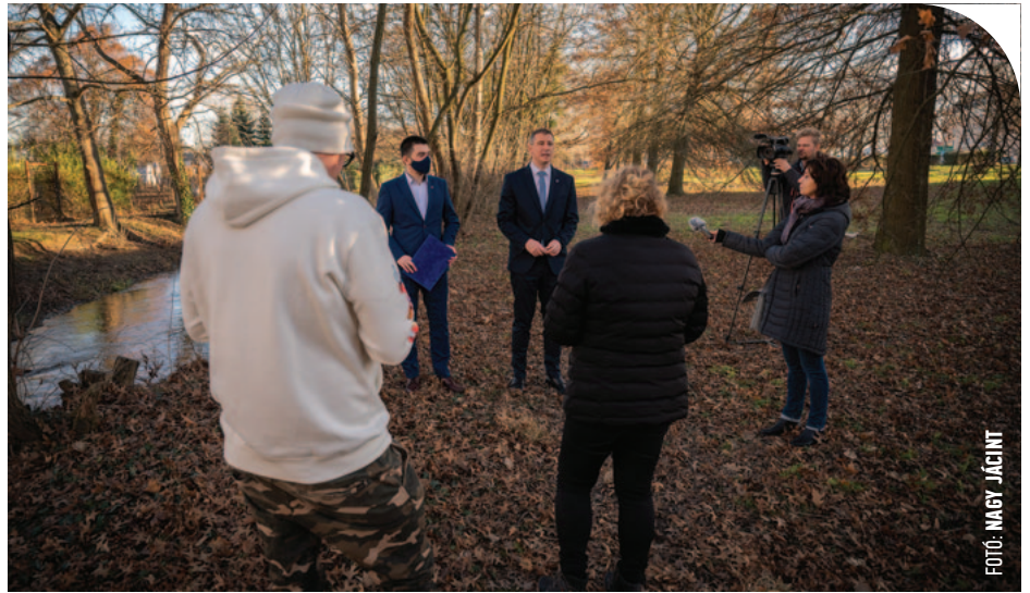
© A Just Nature program sajtótájékoztatója: 156 millió forintot nyert a város

– Megmondom őszintén, nagyon büszke vagyok rá, hogy 156 millió forint közvetlen uniós forrást nyertünk a Just Nature program keretében. A szívem csücske volt ez a pályázat, hiszen saját erőből és saját tervekkel választottak ki minket sok jelentkező közül. Ha minden jól megy, 30 napon belül alá fogjuk írni a támogató szerződést, aztán kezdődhet is a többéves munka: kialakítunk egy környezetvédelmi témaparkot – városi erdőt – a Hunyadi úton, a szőlői templom melletti ósvadonban, illetve a Dési Huber István Általános Iskolát is kizöldítjük kicsit. Nagyon