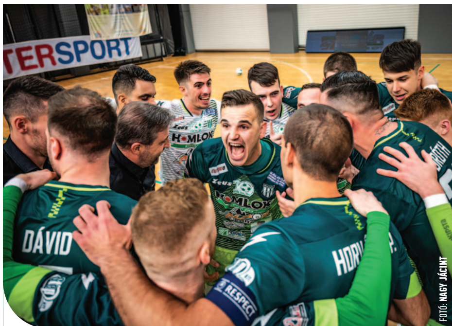
Motiváció és elszántság: egy meccsre az aranyéremtől a HVSE