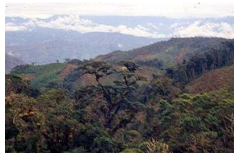
Figura 5. Prumnopitys harmsiana (Pilger) Laubenfels.

= Podocarpus oleifolius var. macrostachys var. (Parl.) Buchholz & N.E. Gray, Journ. Arnold Arb. 29: 140. 1948.