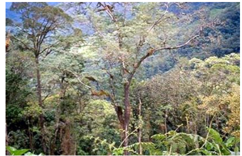
Figura 3. Bosque de La Bermeja en San Ignacio, Cajamarca.

Tropical (bp-MBT). Se trata de una zona de reciente colonización, debido al difícil acceso; por ello aún se pueden observar grandes extensiones de bosque virgen. Debido a su fisiografía tiene muy poco terreno con aptitud agrícola, pese a esto los pobladores establecen cultivos de café, yuca, plátano, con pocos resultados, sólo les alcanza para sus necesidades básicas, la mayor parte de los campesinos establecen pastizales o «invernas».