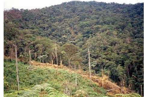
Figura 2. Bosque de Selva Andina en San Ignacio, Cajamarca.

Nuevo Mundo-Piragua (distrito de Huarango): situado a 1550 m (05° 14' 93" S y 78° 38' 42" W) representa bosque pluvial Montano Bajo