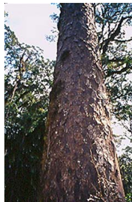
Figura 4. Nageia rospiglosii (Pilger) Laubenfels.

= P. macrostachyas Parl. in DC. Prod. 16. II. 510. (1868).