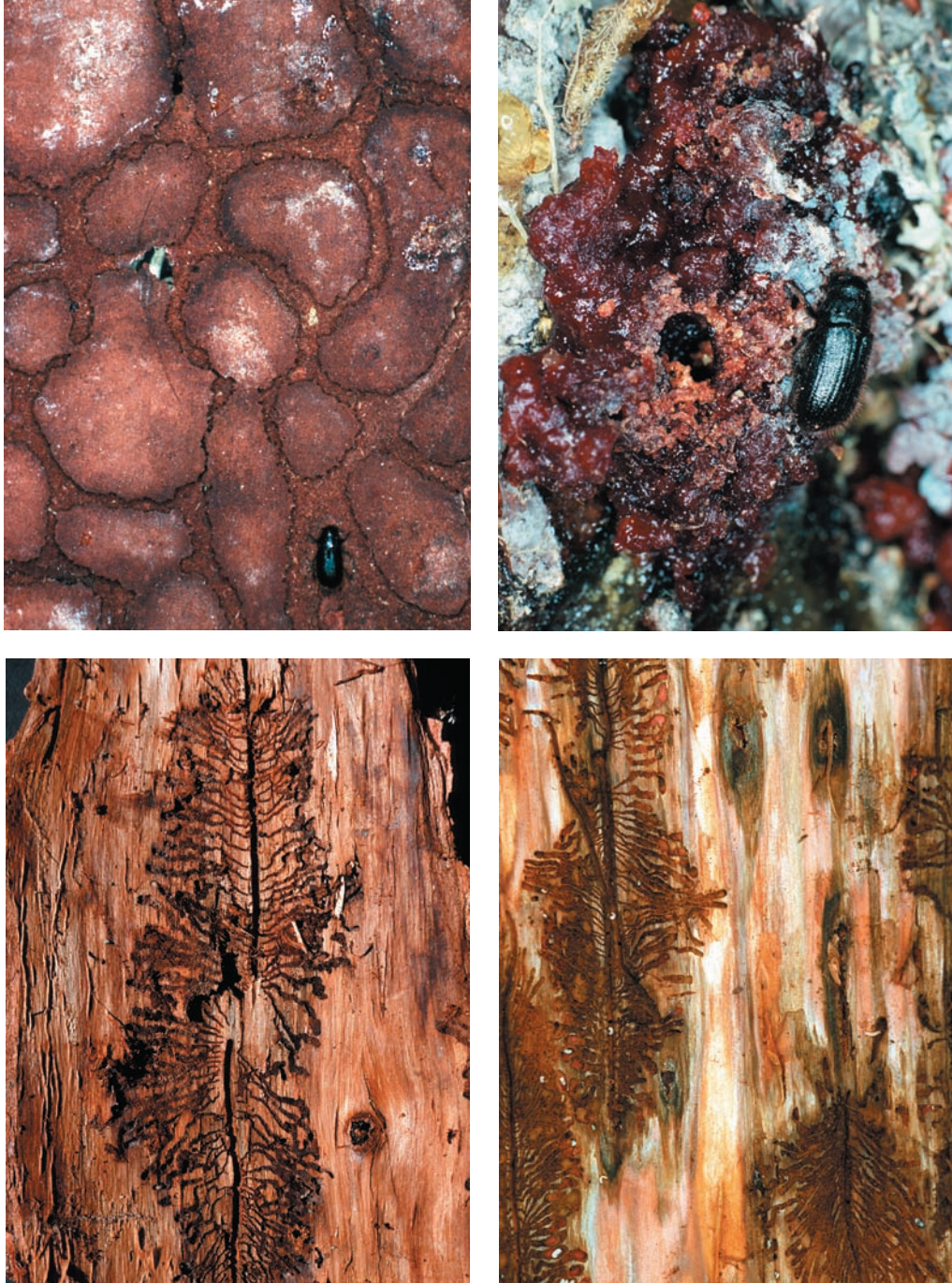
Fig. 9 (links): Fraßbild des achtzähligen Fichtenborkenkäfers Ips typographus (Innichen, VIII. 1990)