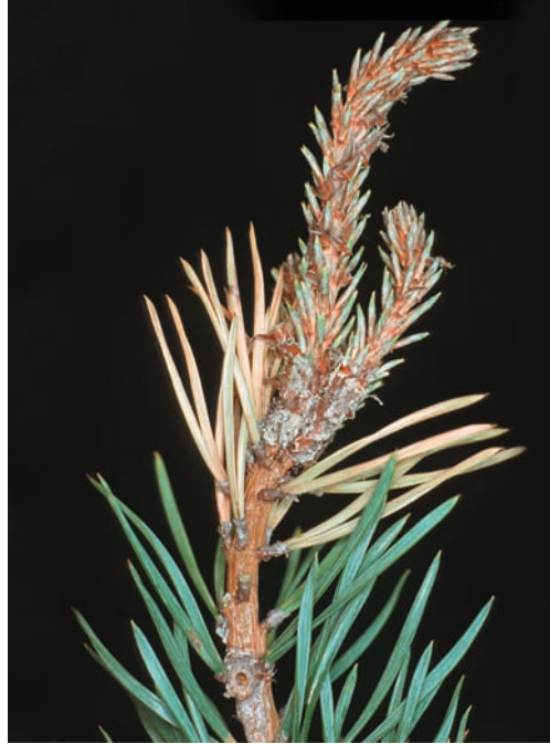
Fig. 3–4: Befallsbilder des Kleinen Waldgärtners Blastophagus minor an Weißkiefer Links: Triebfraß (St. Vigil, VIII.1989). – Rechts: Brutfraß (Aicha, VI.1989)