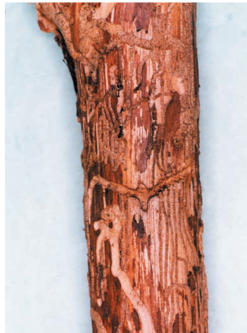
Fig. 5 (links): Fraßbild von Polygraphus cembrae in Ast von Strobe (Vahrn, X.2002)