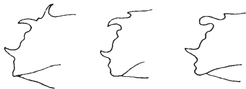
Fig. 11: Tannen-»Hakenzahner« ( Pityokteines ): Absturz-Bezahlung der Männchen: Links: Pityokteines curvidens . – Mitte: Pityokteines spinidens . – rechts: Pityokteines vorontzowi . (nach: SCHIMITSCHEK, 1955).

Die »Hakenzahner« der Gattung Pityokteines sind gefürchtete Tannenschädlinge, kommen aber in Südtirol vermutlich nicht endemisch vor. Sie folgen in Europa der Verbreitung der Tanne ( Abies ) von den Pyrenäen über die Alpen (beiderseits) und Karpathen bis Kleinasien und den Kaukasus, vermeiden nach SCHEDL (1981) aber die inneren Alpentäler. Die bisher in Südtirol vom Verfasser festgestellten Funde der 3 europäischen Arten beziehen sich auf importiertes Tannenrundholz (Kahlen & Hellrigl 1996). Sie leben polygam als Rindenbrüter im Wipfel und Stammbereich kränkelder Bäume; die Muttergänge sind meist querverlaufende doppelte Klammergänge; zur Unterscheidung der Arten: (Fig. 11)