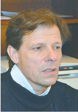
SZERZŐ: DR. SZTERMEN MÁRTON, A SÜRGŐSSÉGI BETEG- ELLÁTÓ OSZTÁLY OSZTÁLYVEZETŐ FŐORVOSA FOTÓ: ILLUSZTRÁCIÓ

A világon mindenhol azért hozták létre a sürgősségi osztályokat, mert rájöttek, hogy a kórházba jutás megkönnyítésével életet lehet menteni. Tíz hónapja nyitotta meg kapuját a győri sürgősségi osztály, jelentős biztonságot adva ezzel a lakosságnak, hogy a tényleg rászorulókon hathatósan segíteni lehessen – ha azoknak, és csak azoknak nyújtjuk ezt a lehetőséget, akiknek erre szükségük van. Mindannyiunk felelőssége tehát, épp a súlyos állapotú társaink érdekében, hogy indokolatlanul ne terheljük meg ezt az osztályt.