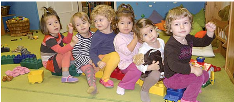
GYŐR, JÓKAI U. 1. 96/423-611, 20/805-1356, WWW.VIDAMKOLYKOK.HU