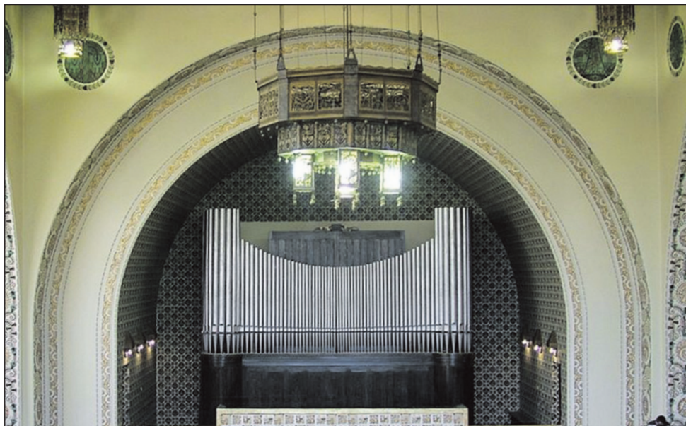
A Fásori református templom orgonája

ge valósul meg, hogy aki egyszer is hallotta, nem tud szabadulni tőle. Lényegében minden stílusra alkalmas hangszer. A barokkra azért, mert abból a korszakból állnak benne sípok. Jelen van benne az a rész, ami a XVII–XVIII. században szólt, de az is, amit a XX. században Pierre Cochereau művészete adott hozzá egy átalakítással, és