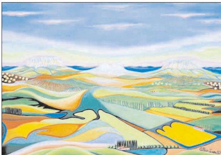
A Káli-medence reggeli fényben

Tájképeinek gyakori témája a Balaton. Nem csoda, hiszen Badacsonyörsön lakik. Művészi hitvallásában így ír: „A festészeti témáimnál mindig törekszem a változatosságra és a színességre.