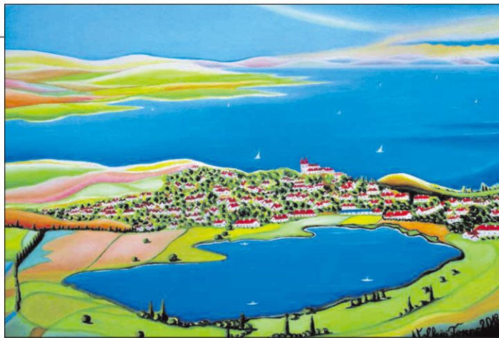
Tihany látképe a Belső-tóval

Képtelen lennék mindig ugyanabban a témában alkotni, mert ez szerintem kiöli az emberből a kreativitást és az alkotókedvet. Ezért rutinból soha nem festettem egyetlen képet sem. Hozzám természetesen – a Balaton szülötteként – a Balaton áll a legközelebb. Megfestettem én azt már minden év- és napszakban. Nálam a Balaton Magyarország és a szabadság jelképe. Itt születtem, a gyermekkoromat, a kamasz- és az ifjúkoromat is itt töltöttem.