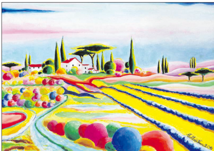
Toszkán tájkép magyar ecsettel VI.: Tavasz Toszkánában

Képtelen lennék mindig ugyanabban a témában alkotni, mert ez szerintem kiöli az emberből a kreativitást és az alkotókedvet. Ezért rutinból soha nem festettem egyetlen képet sem. Hozzám természetesen – a Balaton szülötteként – a Balaton áll a legközelebb. Megfestettem én azt már minden év- és napszakban. Nálam a Balaton Magyarország és a szabadság jelképe. Itt születtem, a gyermekkoromat, a kamasz- és az ifjúkoromat is itt töltöttem.