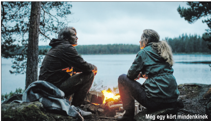
Még egy kört mindenkinek

Thomas Vinterberg rendező a Születésnap (1998) és A vadász (2012) után újra egyesítette erőit Dánia tán legismertebb színészeivel a Még egy kört mindenkinek ( Another round – Druk ) című filmjéhez, és ahogy szokta, most is látványos moralizálás nélkül mesél el egy hétköznapi történetet. A milió nem is lehetne jellegzetesebb, a fölvetett téma azonban csak első pillantásra tűnik egyértelműnek. Vinterberget ugyanis nem az alkohol érdekli, hanem az annak hatása alá kerülő ember viselkedése. Középkorú figuráinak mindegyike hordoz már néhány sebet, és túl van pár megbánt döntésen. Problémákat az ital a kezdeti könnyedség után csak súlyos-