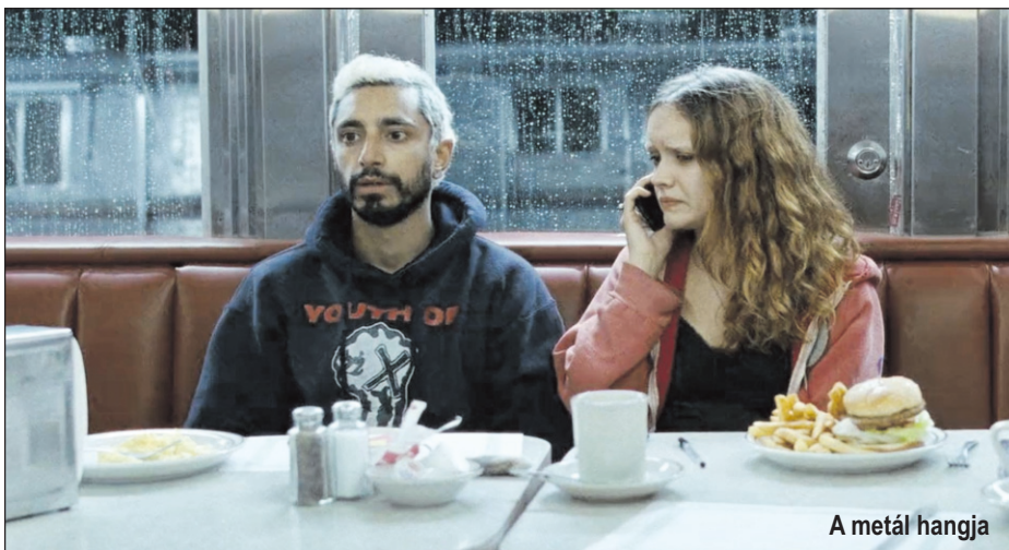
A metál hangja

A Sound of metal (A metál hangja) kezdő képsorai fülsüketítő robajjal fogadják a gyanútlan nézőt: egy metálkoncerten vagyunk. A lány (Olivia Cooke) kiabál, a fiú (Riz Ahmed) dobpüfölléssel kíséri. A műfajt kevésbé ismerők számára mindez riasztó lehet, ám a fiatalokon lát-