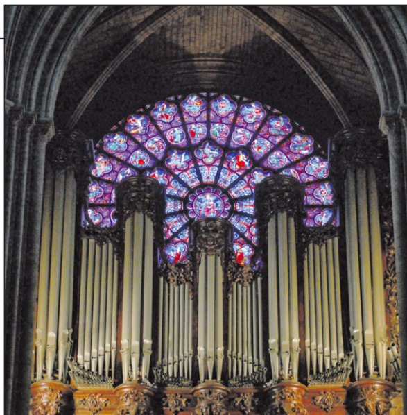
A párizsi Notre-Dame orgonája

– A Notre-Dame orgonája szerintem a világ legkülönlegesebb és legtüneményesebb hangszere. Valójában a szakma is csak kutatja a titkát – ahogyan egy Stradivari-hegedű hangját sem lehet elmagyarázni, szavakba önteni. Talán abban rejlik a titok, hogy négyszáz éven keresztül folyamatosan fejlesztették. Mindig épült egy következő, egy újabb, de úgy, hogy a régit nem takarították el, hanem különös tehetséggel és ráérzéssel hozzáfésülték az újhoz. Vagyis ez az orgona szinte halmozza az évszázados értékeket, legutóbb 2014-ben kapott egy újabb sípművet és játszóasztalt, és immár egy abszolút korszerű digitális rendszer irányítja. A Notre-Dame-ban az orgonahang szépségének olyan töménység-