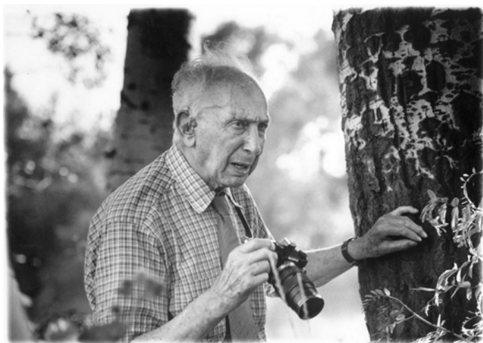
Trencsényi: André Kertész utolsó látogatásán Szigetbecsén, 1984. július 31.

A Szigetbecsei Krónika 2019. 1. számában világhírű fotóművésznünk életének fontosabb eseményeit mutattam be. De vajon hogyan emlékeznek rá azok a szigetbecsei lakosok, akik André Kertészt még személyesen ismerték? Kiknek köszönhetjük, hogy megértették a művész hatalmas kötődését Szigetbecséhez, és minden tőlük telhetőt megtettek munkásságának, tudásának elismerésére, alkotásainak megőrzésére, emlékének állítására itt községünkben.