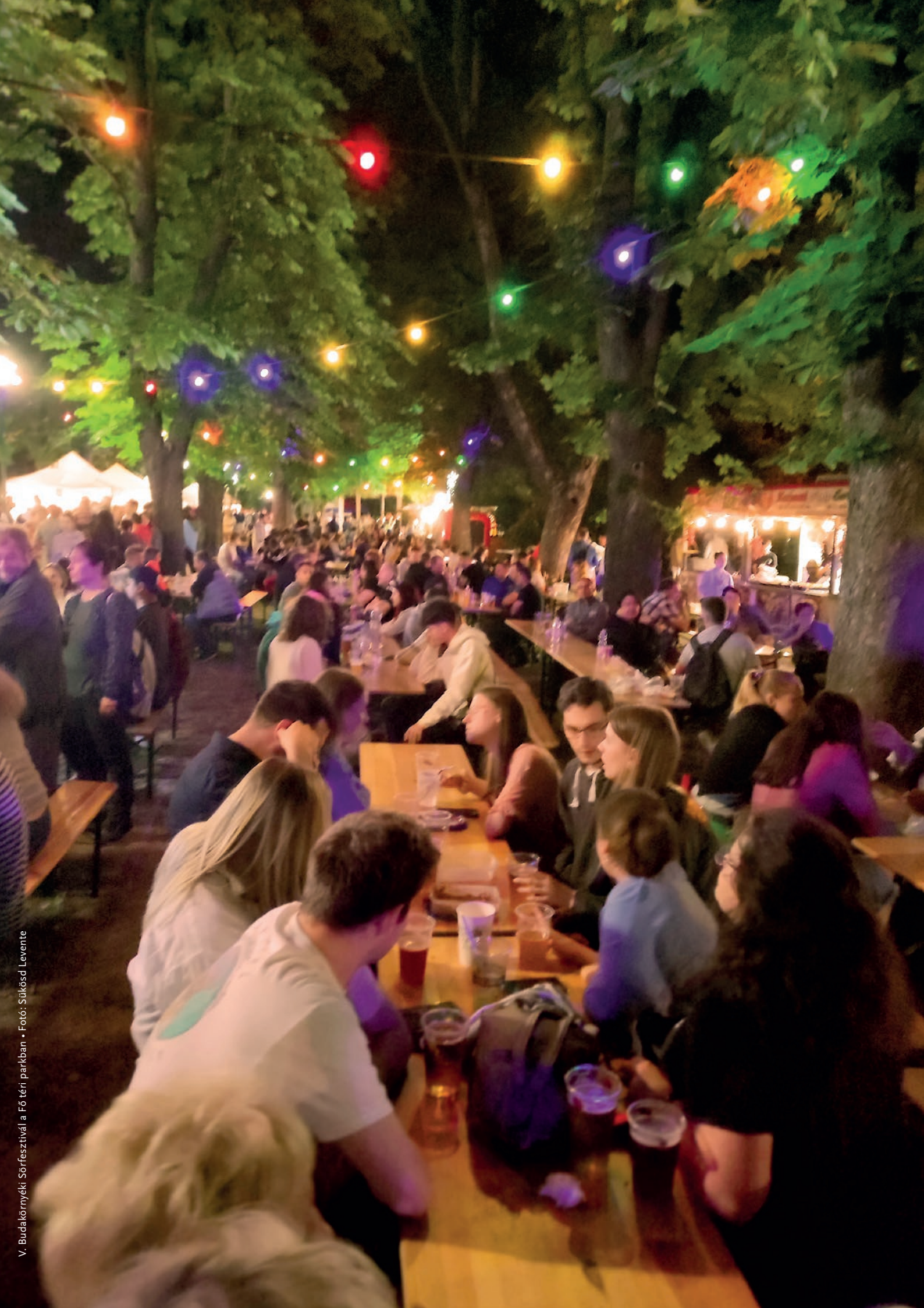
V. Budakörményeki Sörfesztivál a Fő téri parkban