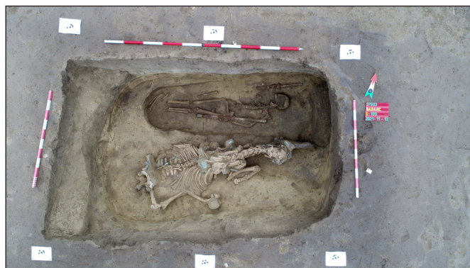
2. kép. Az S-100 padmalyos sír

Az S-1, S-25, S-43 és S-91 sírokba nem egész lovakat helyeztek az elhunyt mellé, csak a ló koponyáját, illetve lábvégcsonthaját lehetett dokumentálni, melyeket valószínűleg az állat bőrével együtt fektettek a sírba. Ez a temetési mód aknasírokban és padmalyos sírokban egyaránt előfordult. A részleges lótemetkezések kivétel nélkül az elhunyt bal oldalán kerültek elő: egy sírban az elhunyttól elkülönítve, három esetben