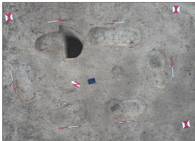
7. kép. A délnyugati szakrális tér