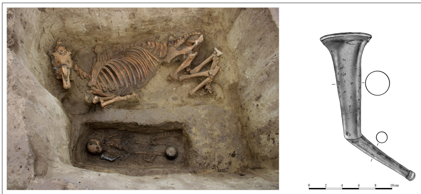
11. kép. Az S-30 padmalyos sír és a sírből származó ivókürt rajza (grafika: Ambrus Edit)

Az S-1 és S-30 sírből (11. kép) egy-egy ezüst ivókürt került elő; emellett az S-1 sír egy ezüst poharat is rejtett. E tárgytypus igen ritka az avar kori emléanyagban: Bócsáról egy szerves anyagból (valószínűleg fából) készült rhyton aranyveretei, míg Kunbábonyról egy színarany darab (H. TÓTH & HORVÁTH 1992, 36, Taf. 8), valamint Szeged–Átokházáról egy további példány (GARAM 2002, 98–99) maradt ránk. A legjobb párhuzam talán a publikálatlan kunpeszéri temető 3. sírjában talált ezüst ivókürt lehetett, ez azonban elporladt (BALOGH 2016, 72). Ugyancsak megsemmisült ivókürtöt ismerünk Ozora–Tótipusztáról (PROHÁSZKA 2012, 74–76). A Kárpát-medencéből kitekintve hasonló, aranylemezből készült ivókürtöt találunk a Malaja perescsepinai leletegyüttesben is (ЛЬБОВА 1989, 48).