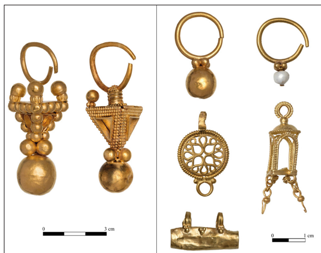
8. kép. Válogatott aranytárgyak a temetőből

Főleg a női és a gyermeksírokban az elhunyt nyakában számos csüngőt, átfűrt és függesztőfüles pénzermét (S-2, S-32, S-71) és gyöngyöket találtunk. Külön ki kell emelni az S-28 sírt, ahol az elhunyt nyakcsigolyái körül számos ezüst lemezgyöngy feküdt. A tárgytypus a 7. század második harmadára jellemző, főleg a Tiszántúlon terjedt el (LÖRINCZY & RÁCZ 2014, 155–156). A Mohács-Téglagyár 3. sírjában talált bordázott galléros gömböt Kiss Attila gömbcsüngős fülbevaló alsó tagjaként írta le (vö. KISS 1974, 137, Fig. 15), de