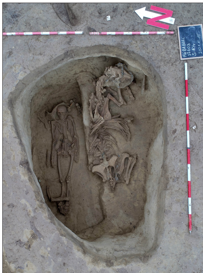
3. kép. Az S-104 padmalyos sír