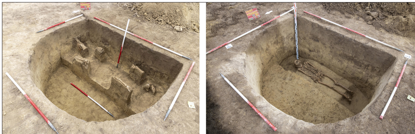
4. kép. Az S-96 sír aknarészében kibontott nyúzott szarvasmarhabőrös temetkezés

Az S-96 sír aknarészébe egy szarvasmarha nyúzott bőrét helyezték a koponyával és az alsó lábszárakkal (4. kép). Ez a rítus a Tiszántúlon általánosnak mondható. 7 A Dunántúlon a Szekszárd-Bogyiszlói úti temető 314 és 742. sírjaiban volt egy-egy szarvasmarha részleges maradványa. A szekszárdi lelőhelyen a részleges állattemetkezések esetében gender alapú kettősség figyelhető meg: míg a férfiak sírjába részleges ló-, addig a nőkében részleges szarvasmarha- és juh-temetkezéseket találunk. Habár a kérdésben a tiszántúli sírokra statisztikai vizsgálat nem született, a kisebb lelőhelyek alapján ott is hasonló tendenciák figyelhetők meg (GULYÁS megjelenés alatt).