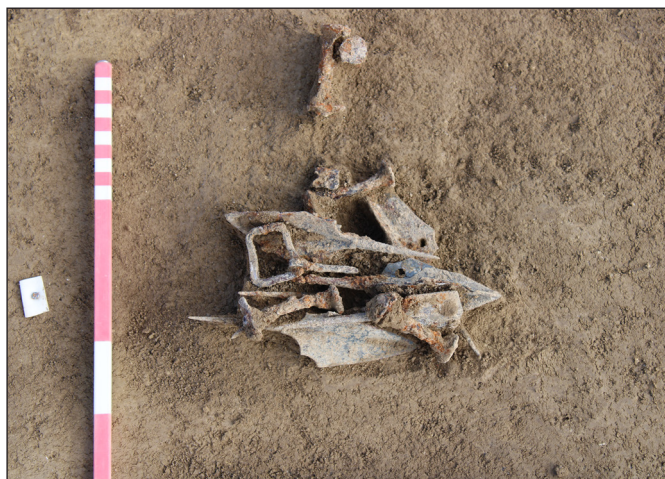
6. kép. Az S-44 áldozati jelenség leletei