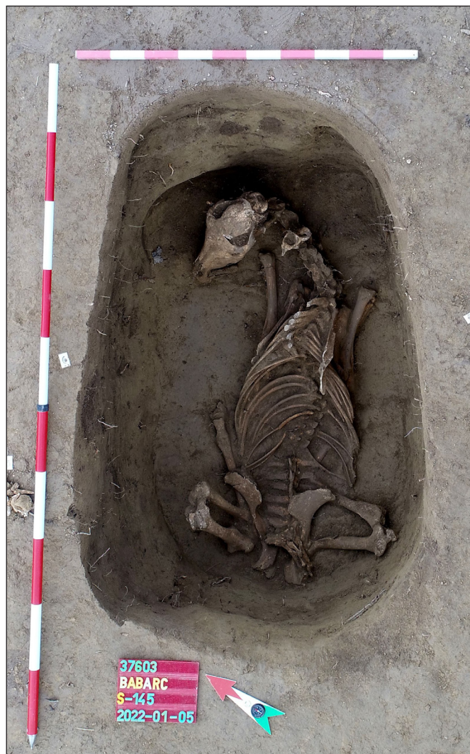
5. kép. Az S-145 lósír

A feltárt terület északkeleti negyedében volt a legnagyobb áldozati tér. Itt az előbbihez hasonló, négy hosszúkas gödör által határolt teret tártunk fel (GALLINA ET AL. 2022, 312–313, 7. kép 2). Két gödörben szétört kerámia, két másikban pedig bronz és aranyozott bronzveretek voltak. Ezek közül az egyik gödörben (S-67) egy faedény háromszög alakú, poncolt díszítésű peremveretére bukkantunk. Párhuzamát a kunbábonyi kagán sírjában lelt fa ivócsésze peremvereteiben (H. TÓTH & HORVÁTH 1992, Taf. 6. 40–41) és