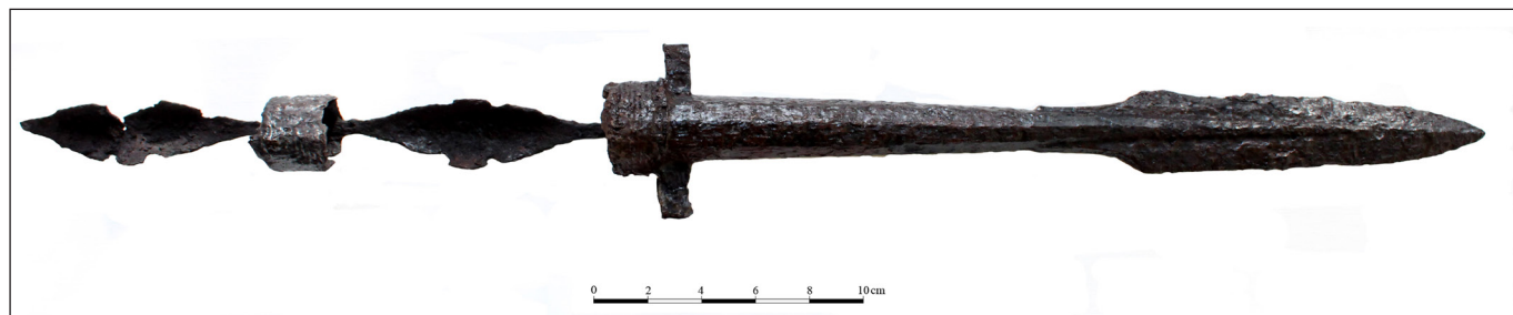
9. kép. Az S-100 sírból előkerült kampós lándzsa

Több férfi- és két önálló lósírban is volt nádlevél alakú vaslándzsa. Az S-100 sírban egy rendkívül hosszú, alsó részén már pántokra bomlott köpűjű lándzsacsúcs volt, melyen két kidudorodás figyelhető meg (9. kép). Ezt a típust a német szakirodalom kampós lándzsának ( Hakenlanze ) nevezi. A 4. században, a Római Birodalom nyugati provinciáiban tűnik fel; ezt követően használatuk folyamatos, bár csak a 8. században terjednek el nagyobb számban (CSIKY 2015, 339–340). A Kárpát-medencéből a babarcin kívül csak egy dévényújfalusi (Devínska Nová Ves, Szlovákia) és egy sőjtöri példány ismert, ezek azonban már a késő avar korra datálhatók (CSIKY 2015, 136).