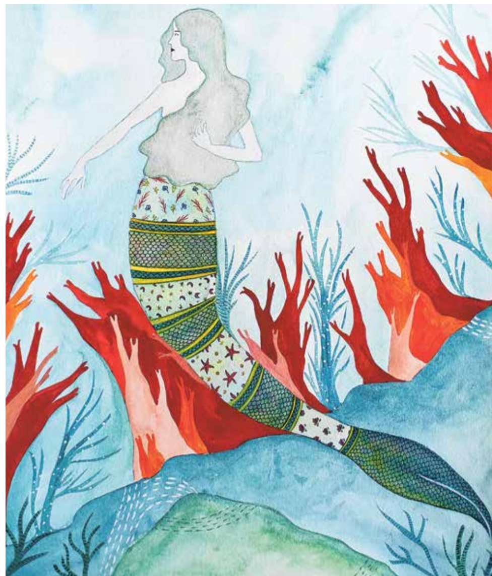
ILLUSZTRÁCIÓ: KLING EMMA AKVARELLE