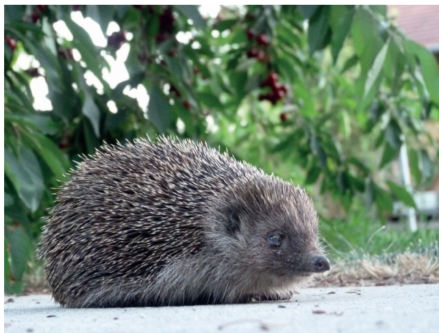
A hónap képe.