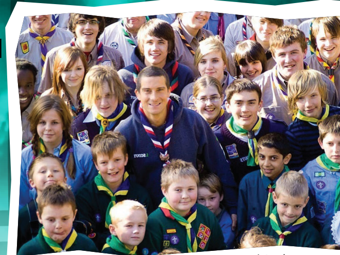
az angol főcserkész igen nagy népszerűségnek örvend

Legjobban azokat a programokat szereti, ahol cserkészekkel hűzázhat. Aktív alakítója a Cserkész Közösségi Hét-nek. Az Egyesült Királyság cserkészei ezen az eseményen a helyi közösségekkel közösen találgatják ki, melyek azok a feladatok, amik holaszthatatlanul megoldásra várnak. Tulajdonképpen azt határozzák meg, mi az, amivel lakóhelyüknek leginkább javára válhatnak. Mivel kitalálták, természetesen meg is valósítják. Ez szólhat egy elhanyagolt játszótér felújításáról, járdák, utak kisebb hibáinak kijavításáról, vagy akár idős emberek meglátogatásáról is.