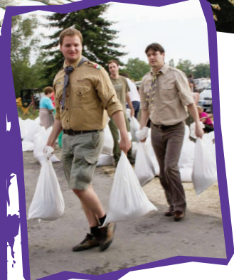
a cserkészirodában dolgozók is kivették a részüket a munkából

Szélsőséges körülmények között, ki-tartó önkéntességgel mutatott jó példát a cserkészlet. Az idei dunai árvíz rekordot döntött, és a felkészült hivatásosok munkája mellett is nagy pusztítást végezhetett volna. Idén azonban rég nem látott összefogás valósult meg a közös cél érdekében. Június 6. és 9. között több mint egy tucat budapesti és vidéki helyszínen, folyamatos koordináció mellett vettek részt cserkészek az árvízvédelmi munkálatokban. A legtöbben homokzsákokat töltöttek, pakoltak teherautóra vagy éppen a gátra, de volt, aki kitelepítésben és buzgármentesítésben segédkezett. Többen extrém körülmények között, sürgős hívásra reagálva, vízben állva építettek gátat, vagy éjszakai szolgálatot láttak el. Köszönjük nekik!