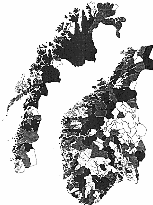
MAP 1. Diff. in % Between Turnout in 1972 and 1994.