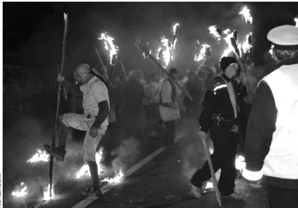
A „kecskeégetésre” érkező román és magyar ünneplők három napon át verekedtek Gorzafalván

Gorzafalván sem volt feszültségmentes az újév, a településre ugyanis háromszáz bákói csendőrt kellett kivezényelni, ugyanis tömegverekedésbe torkollott a rituális újévköszöntés. A „kecskeégetésre” érkező román és magyar ünneplők összecsap-