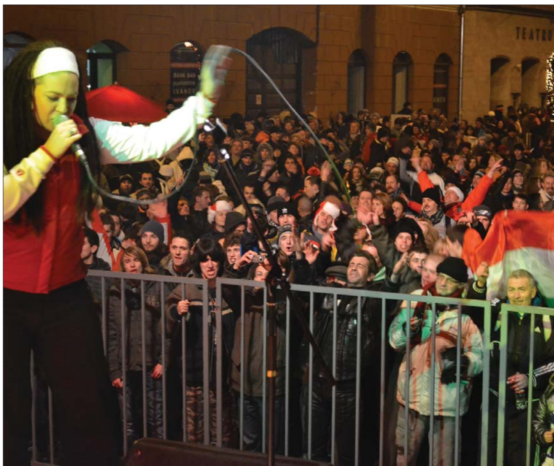
Tízezer tömeg előtt koncertezett a sepsiszentgyörgyi szilveszteri utcabálon a Zanzibár