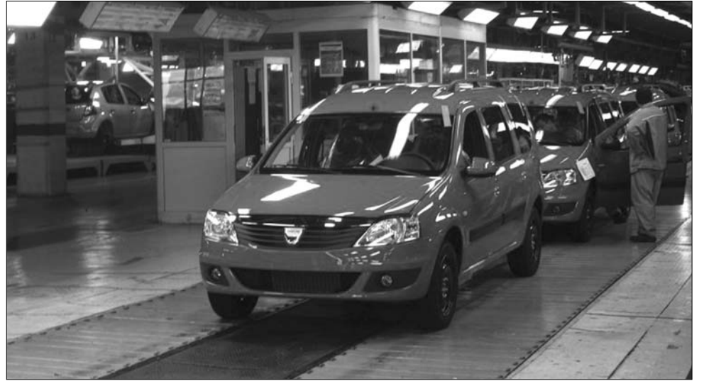
A romániai gazdaság fő motorja idén is az export lesz, amelyről a Dacia tevékenysége „gondoskodik”

A szűkös idővel dacolva viszont mégsem fog vissza-