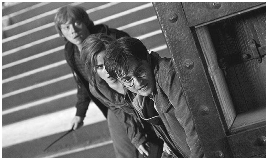
A Harry Potter című filmnek a Halál ereklyéi 2. című része 1,32 milliárd dollárt termelt tavaly a filmszínházakban

Annak ellenére, hogy három film is elérte 2011-ben az egymillió dolláros bevételt, az ameri-