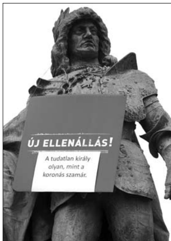
Mátyás király, táblával a nyakában

Az LMP tegnap arról számolt be, hogy szélsőjobb oldali tüntetők két szimpatizánsukat is dur-