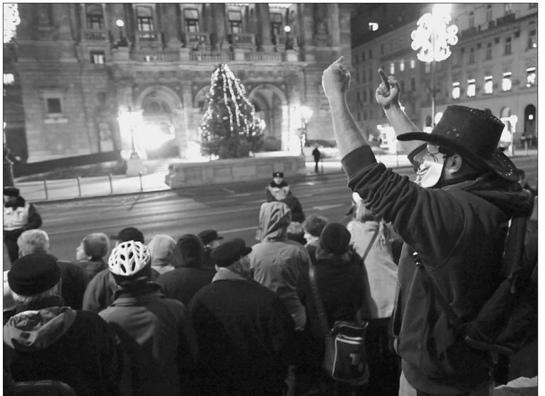
„Operabál” az utcán. Jellegzetes és indulatos mozdulattal fejezik ki véleményüket a Fidesz-kormányról