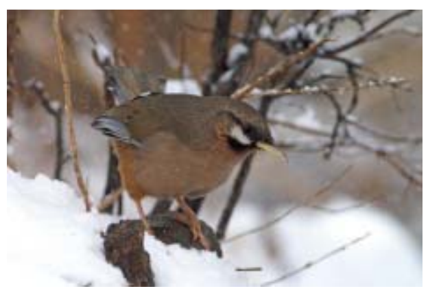
黑额山噪鹛

也可以去走走竹根岔沟,这条沟据说可以穿越到 黄龙风景区,但路途艰险。此沟为大熊猫常出现的地 方,不便多去,我在此花的时间不多,具体鸟况不 详。