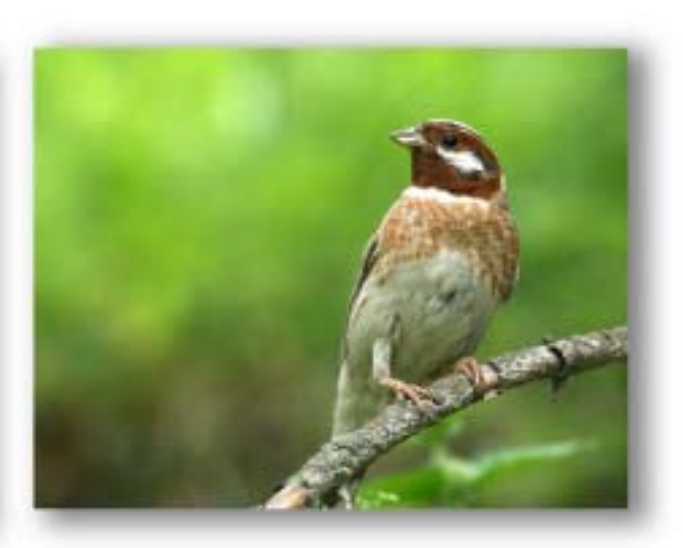
白头鹀 Emberiza leucocephalos