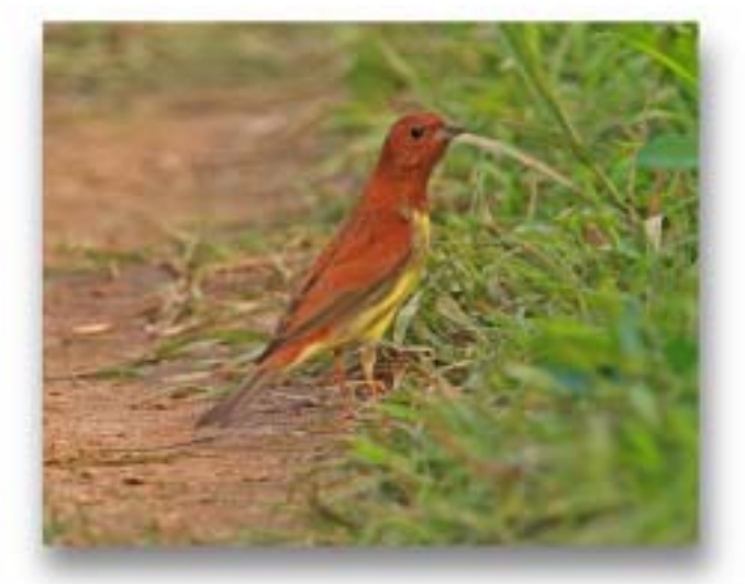
栗鹀 Emberiza rutila