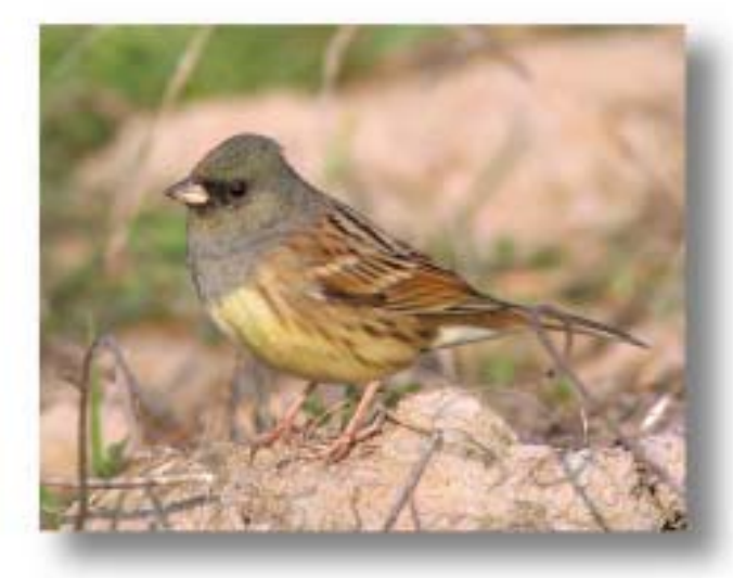
灰头鹀 Emberiza spodocephala