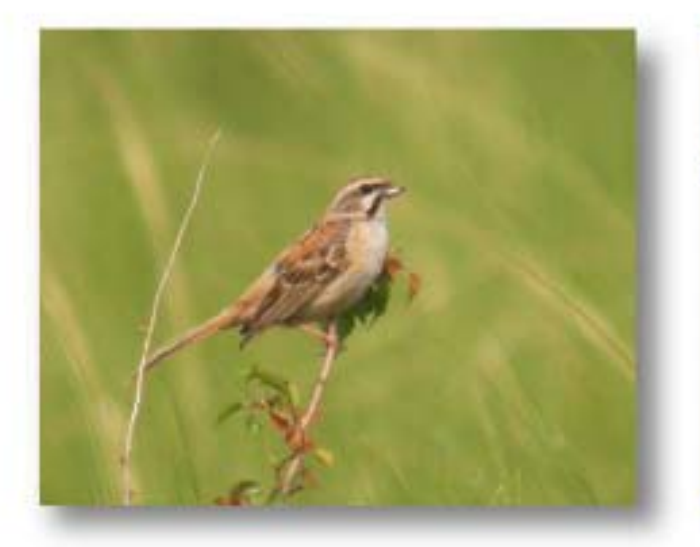
栗斑腹鹀 Emberiza jankowskii