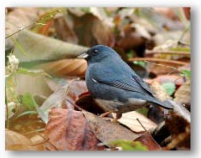
蓝鹀 Latoucheomis siemsseni