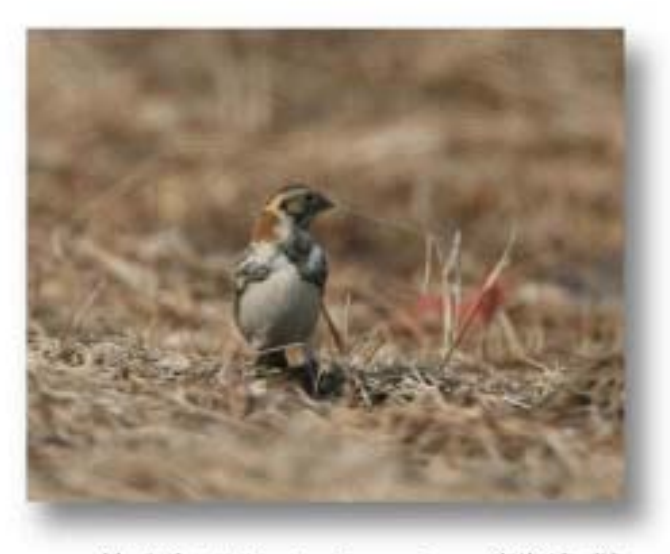
铁爪鹀 Calcarius lapponicus

铁爪鹀 Calcarius spp. 蓝鹀 Latoucheornis spp. 凤头鹀 Melophus spp. 朱鹀 Urocynchramus spp.