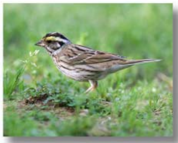
黄眉鹀 Emberiza chrysophrys