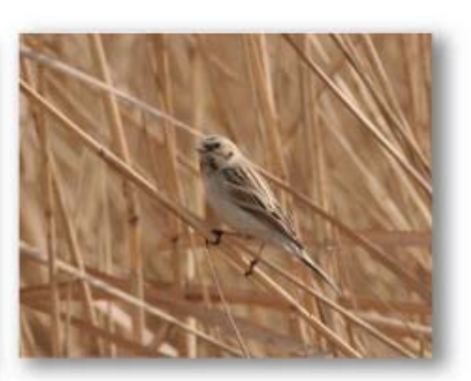
苇鹀 Emberiza pallasi