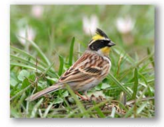
黄喉鹀 Emberiza elegans