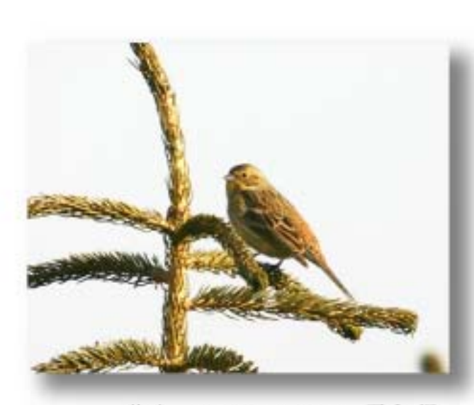
黄鹀 Emberiza citrinella