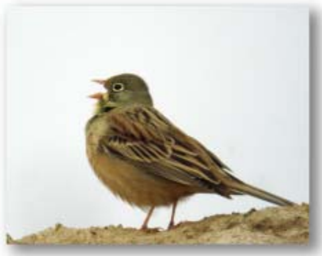
画码 Emberiza hortulana