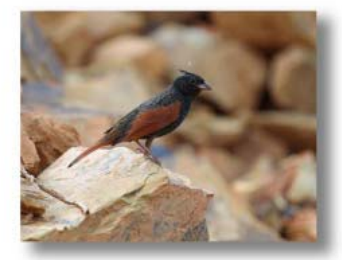
风头鹀 Melophus lathami