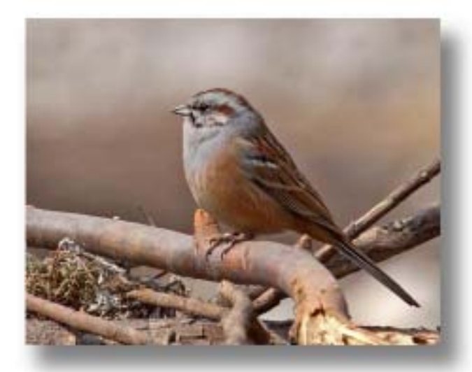
戈氏岩鹀 Emberiza godlewskii