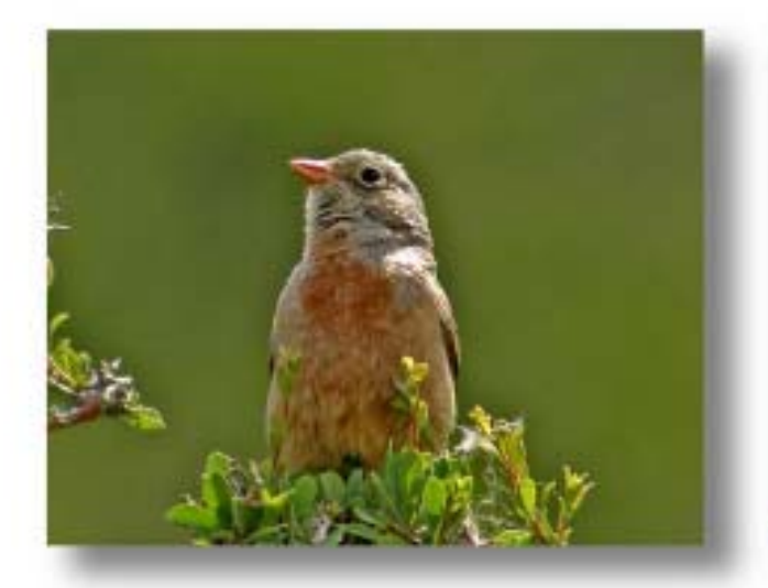
灰颈鹀 Emberiza buchanani