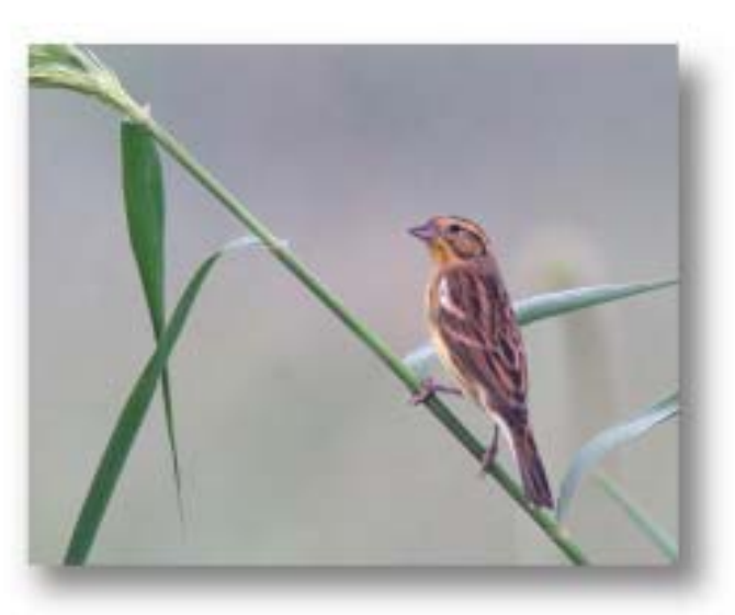
黄胸鹀 Emberiza aureola