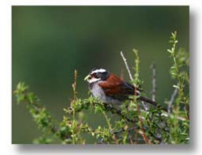
藏鹀 Emberiza koslowi