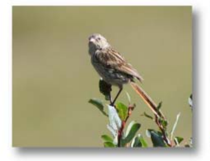
朱鹀(雌) Urocynchramus pylzowi