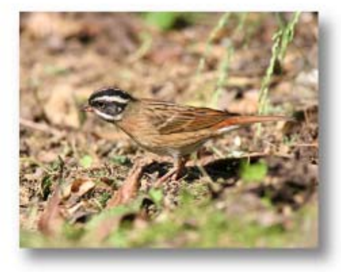
白眉鹀 Emberiza tristrami