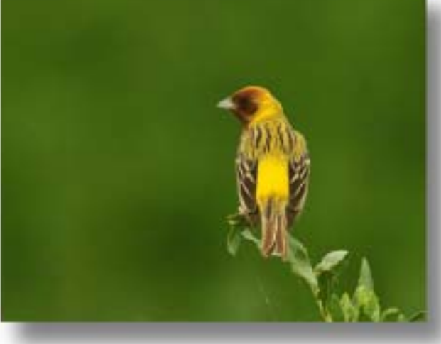
褐头鹀 Emberiza bruniceps