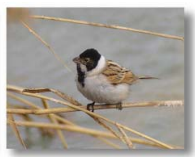
芦鹀 Emberiza schoeniclus