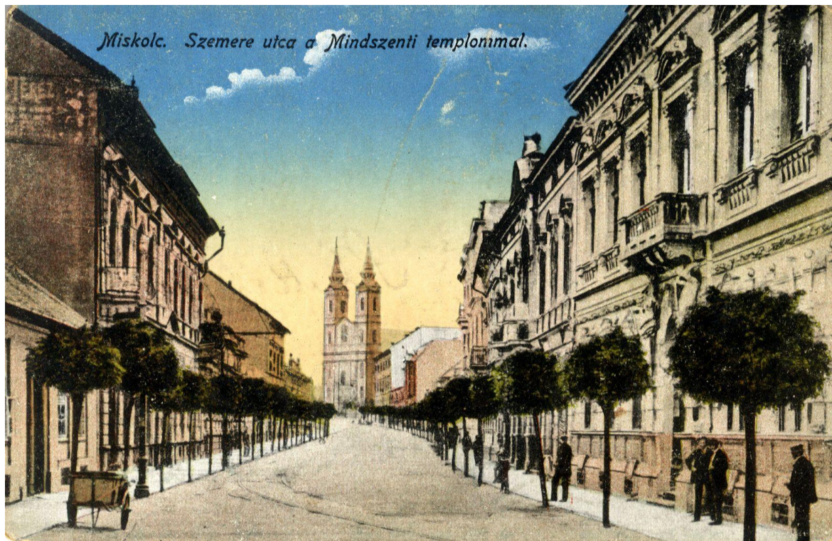
6. A Szemere utca, háttérben a Mindszenti plébániatemplommal képeslapon, 1900 körül.

a Szinvába, a patak mentén pedig időről-időre trágyadombokat halmoztak a renitens állattartók. A városi közgyűlés sokat foglalkozott a kérdéskörrel, 1874 szeptemberében ismét megállapította, hogy a „Szinv patak vize különböző okok miatt bűzhödt s ártalmas szagot terjeszt”. Ezúttal lajstromba foglalták a káros tényezőket: „az árnyékszék tisztítására vállalkozott egyének az ürülékeket nagyobb részben a Szinv árkába öntik, s a jelenlegi esőtlen időben a molnárok által különben is felfogott Szinvában le nem folyhatik, s így megülepszik, a pálinkafőzők a moslékokat a város hosszában mindenütt a Szinvába öntözik, a sertések a megbűzhödt iszapot a Szinv medrében, partjain naponként feltúrják, az eldöglött állatok hullái a Szinvába dobatnak”. 87