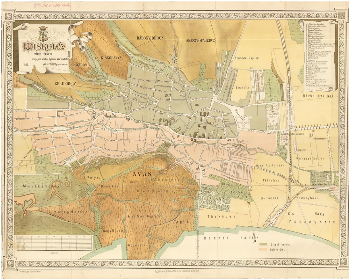
2. Miskolc város Adler-féle térképe, 1885.