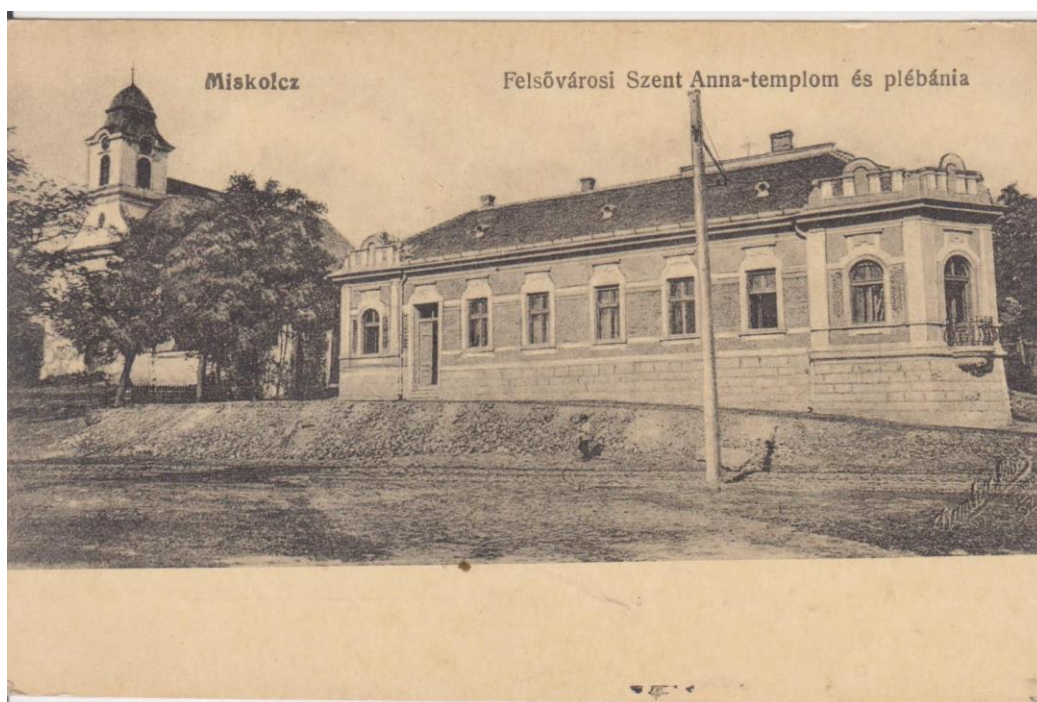
3. A Szent Anna-templom és plébánia képeslapon, 1910 körül.

A Diósgyőrből érkező út elhaladt a Szent Anna (másképpen Veres) templom és a túlsó – az ápoldáéval azonos – oldalba épült koronauradalmi serház előtt. Mindkét épület megélte a jelent és már a tárgyalt korszakunkban jelzőpontként hivatkoztak azokra. A katolikus Szent Anna templom 1816 és 1823 között épült, Felső-Miskolc egészének a lelki központja volt. Profán a földrajzi közelség, de a serházat is anynyira jelentősnek érezték a kortársak, hogy arról nevezték el a Tizeshonvéd utca elődjét.