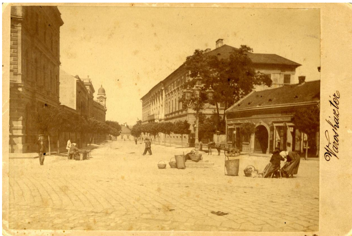
4. A Városház tér képeslapon, 1910 körül.

A tér valódi jelzőpontjairól eleddig hallgattunk. Az újabb megyeháza 1811 és 1837 között épült, jelentős károkat szenvedett az 1843. évi tűzvész során. Helyreállítása után lényegében nem változott korunkban, előtte petróleumlámpák világítottak. A szemközi városháza éppen 1871-ben épült és az elkövetkezendő években is téma volt a fejlesztése, korrigálása. A lakosság óvó figyelemmel övezte Miskolc új díszét, melynek homlokzatát 1876 szeptemberében „vakolat” színnel festették át. A helybéli hetilapnak ez ellen nem is volt kifogása, de azt szövé tette, hogy „természetellenes azonban az alkalmazása, mert az alapszínnek és nem a kiálló részeknek kellett volna sötétebbel festve lenni, miután nagyon természetes, hogy a kiemelkedő részek vannak mindenben jobban megvilágítva”. 51 A tér maga ugyanazon évben odaültetett akácfákkal vált hangulatosabbá. Sajnálatos, hogy akadt bőven rossz szándék, a közérdeket védő sajtó 1876 nyarán mutatott rá a „nyomorult gaztetre”, hogy egy vandál kéz „8 fát késsel szándékosan bevagdalt”. 52