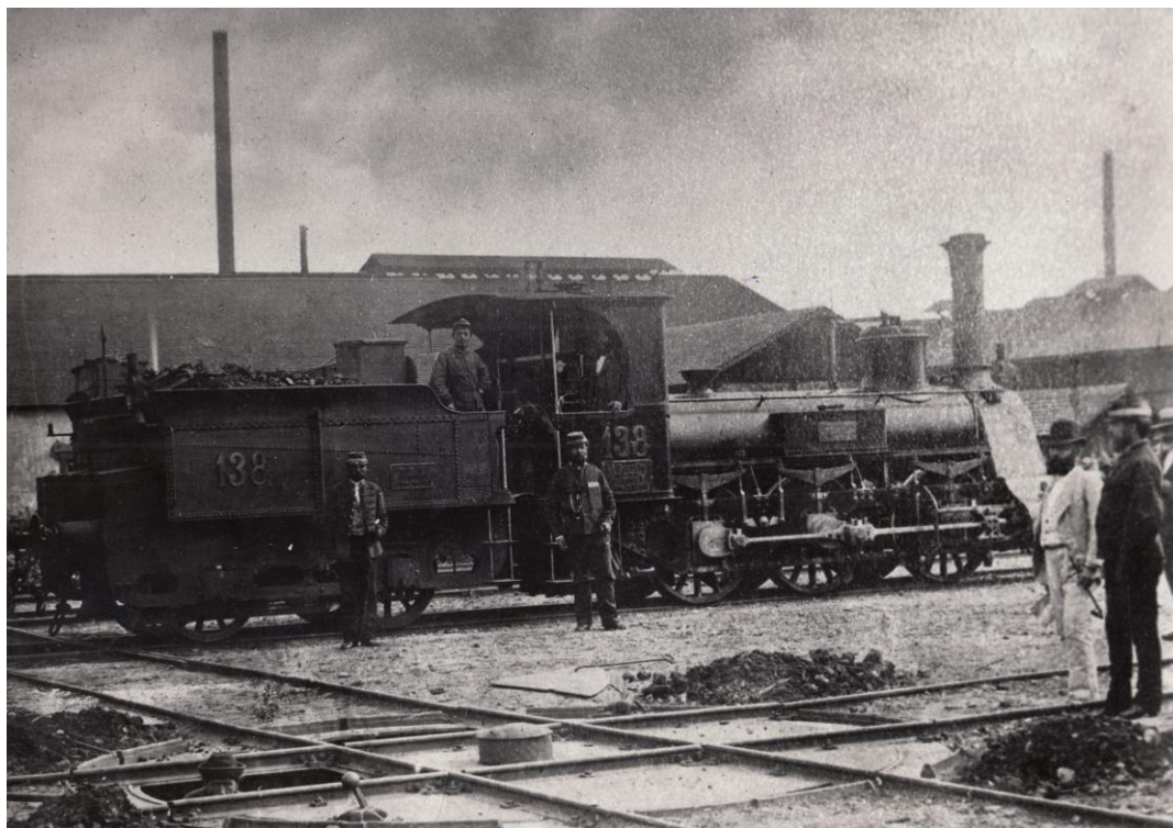
1. A vasgyári vasútállomás és mozdony 1900 körül készült fényképen. HOM HTD 79.441.1.