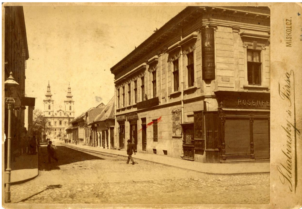
5. A Boldogasszony (mai Déryné) utca a színház keleti oldalában képeslapon, 1900 körül.