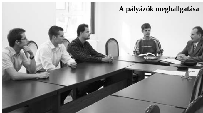
A pályázók meghallgatása

1984-ben születtem Karcagon, általános iskolai és gimnáziumi tanulmányaimat Püspökladányban végeztem. 2002-