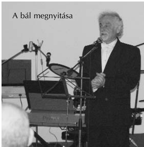
A bál megnyitása

B ál volt, igazi, jó hangulatú bál, ha nem is a Savoy-ban, de a Savoyai kastélyban Ráckeven.