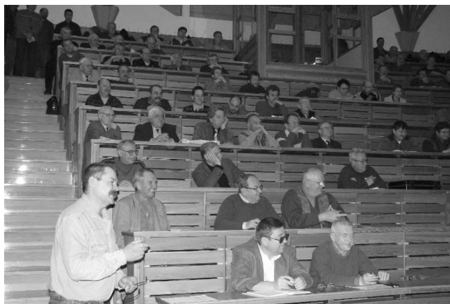
Levezető elnök munkában

E gy Pest megyei állatorvos számára nem is kezdődhet másként a február, mint a kétnapos továbbképzéssel, amit a hagyományokhoz igazodva február 1–2-án rendeztük meg Üllőn, a Nagyállatklinikán.