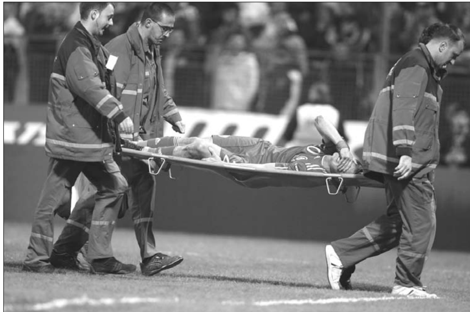
Újabb román megaláztatás színhelye volt a délszláv térség: Belgrád után Zenicán is elváltak

A D csoport másik két találkozója: Luxemburg-Franciaország 0-2 (gólok: Mexes 28. perc és Gourcuff 72. perc) és Albánia-Fehéroroszország 1-0 (Salhi 62. perc). Kedden, 19.45 órakor, Piatra Neamțon, Románia Luxemburgot fogadja, de trikolórok még győzelem esetén sem javíthatnak helyezésükön. A csoportban a sor-