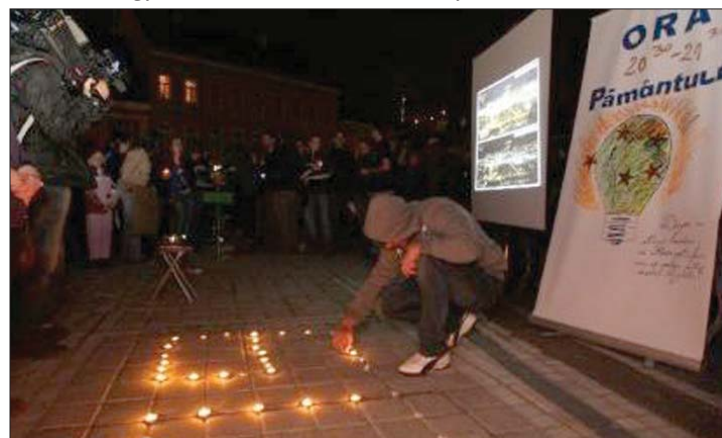
Elsötétítés Brassó központjában. Az egyórás akciót a Tanács téren tartották

monstráció több erdélyi városban is egész napos programmá bővült, egy percen át mindenhol a japán földrengés áldozataira emlékeztek a környezetvédők. 7. oldal ▶