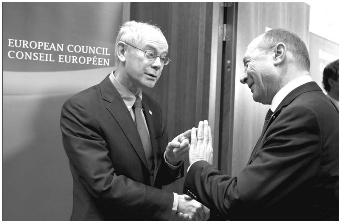
Herman van Rompuy, az Európai Tanács elnöke és Traian Băsescu Brüsszelben. Románia is csatlakozott a paktumhoz

Módosították az Európai Unió tagországainak állam- és kormányfői pénteken befejeződött brüsszeli találkozásukon az EU alapszerződését, emellett állást foglaltak arról, hogy világszerte fontos volna biztonsági szempontból tesztelni az atomreaktorokat. A kétnapos értekezletet követően – a mostani csúcson megszületett gazdasági-pénzügyi megállapodás mellett – Orbán Viktor magyar miniszterelnök a soros elnökség időarányosan kitűzött és elért céljai közül kiemelte az európai szabadalom ügyét, a nemek közti egyenlőség kérdését, az észak-déli infrastruktúra-összeköttetésekről született megállapodást, valamint az energiastratégiát is. A mostani csúcstalálkozón véglegesen döntöttek az uniós vezetők az EU alapszerző-