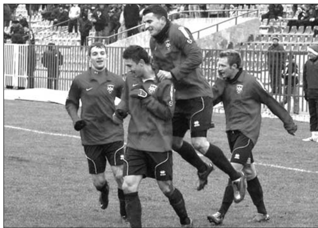
A Bihar FC 1-0-ra nyert a feljutásért hajtó Dacia Mioveni otthonában

Jó formában, a Bihar FC 1-0-ra nyert a feljutásért hajtó Dacia Mioveni otthonában, a nagyváradiak gólját Oltean szerezte a 68. percben. Fontos három pontot szerzett a