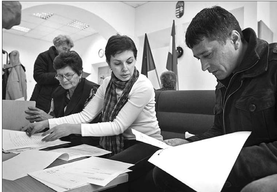
Nincs pontos adat arról, hány erdélyi roma kérvényezett eddig magyar állampolgárságot