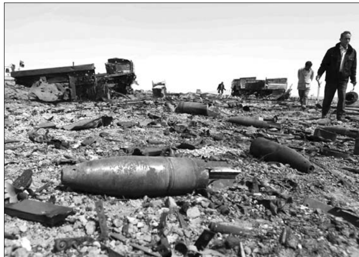
„Tájkép csata után.” Lőszer- és jármőröncsok Adzsdábija városa mellett

Közben a líbiai felkelők tegnapra elérték el-Ukeilát, az utolsó várost a nyugatabbra fekvő, stratégiai jelentőségű Rasz Lanúf olajkikötő felé vezető úton, és sikerült ellenőrzésük alá vonni az Adzsdábija és el-Ukeila között fekvő Brega városát is, amely egy héten át a kormányerők kezén volt: a város fontos olajterminál. Ugyancsak a felkelők kezére került Rasz Lanúf, amely ugyancsak jelentős olajkikötő. A kormányerők folyamatosan vonulnak vissza Kadhafi szülővárosa, Szirt felé. ◀