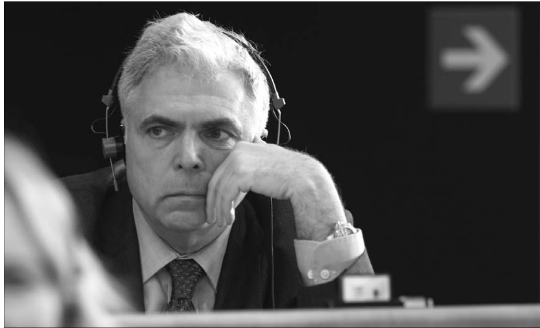
Adrian Severin egyelőre hajthatatlan: az európai parlamenti képviselő nem akar megválni mandátumától

Liviu Dragnea, a PSD főtitkára szinte biztos abban, hogy a korrupciógyanúba keveredett EP-