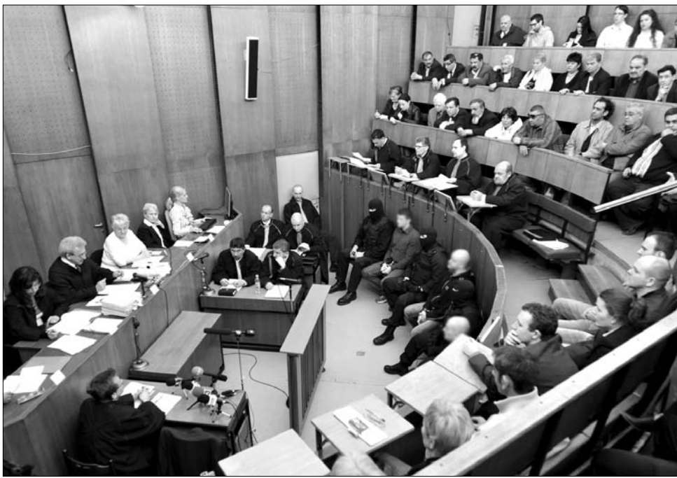
Az igazságszolgáltatás (fél)körében. Biráik előtt a magyarországi romagyilkosságok elkövetői