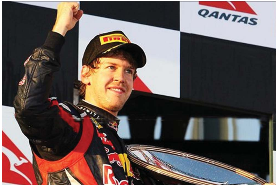
A német pilóta győzelme egyetlen pillanatig sem forgott veszélyben Melbourne-ben

A 23 éves Vettel már a rajttól nagyszerűen jött el, s pillanatok alatt jelentős előnyt szerzett. Főlényére jellemző, hogy a 15. körben, miután kiállt kerékcserére, még gond nélkül vissza tudott térni az élre. Győzelme – amely pályafutása 11. GP-elsősége