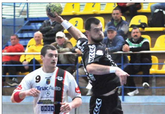
Az udvarhelyiek kikaptak, és elvesztették az élvonalosi pozíciót is

A női Nemzeti Liga 21. fordulójában: Kolozsvári U-Jolidon–Resicabányai U 33-21, Oțetul Galac–Tomis Konstancia 33-25, HCM Roman–Nagybányai Știința 26-18, Zilahi HC–SCM Craiova 26-20, HC Dunărea Brăila–Oltchim 15-32. A CS Municipal–Brassói Rulmentul- és HCM Buzău–Dévai Cetate-találkozókat március 30-án, szerdán pótolják. ◀