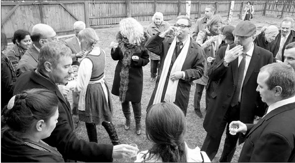
A magyar-indiai barátságra koccintott Kelemen Hunor és vendége Csomakőrösön

Kelemen Hunor kulturális és örökségvédelmi miniszter tegnap Csomakőrösre látogatott Jahwar Sircar indiai kulturális miniszter társaságában. A két ország tárcavezetője a tibetológia megalapítója születésének 226. évfordulójára emlékezve koszorút helyezett el mellszobránál, és látogatást tettek a Kőrösi Csoma Sándor-emlékháznál és -múzeumnál. Az indiai kulturális miniszter hivatalos látogatásra érkezett Romániába, programjában azért szerepelt a csomakőrösi látogatás, mert ő maga kutatóként foglalkozott Kőrösi Csoma Sándor életútjával, munkásságával. Ezt követően Kelemen Hunor sajtótájékoztatót ismertette a Kulturális és Örökségvédelmi Minisztérium 2011-es Országos Műemlék-felújítási Terv Kovászna megyére vonatkozó részleteit. „Az elmúlt években Háromszék hátrányosan megkülönböztették, ami a műemlék épületek felújítását illeti” – értékelte a művelődésügyi miniszter. Elmondta, 2007-ben 4, 2008-ban 3, 2009-ben pedig két műemlék épület szerepelt a kulturális tárca felújítási tervében. Ezzel szemben