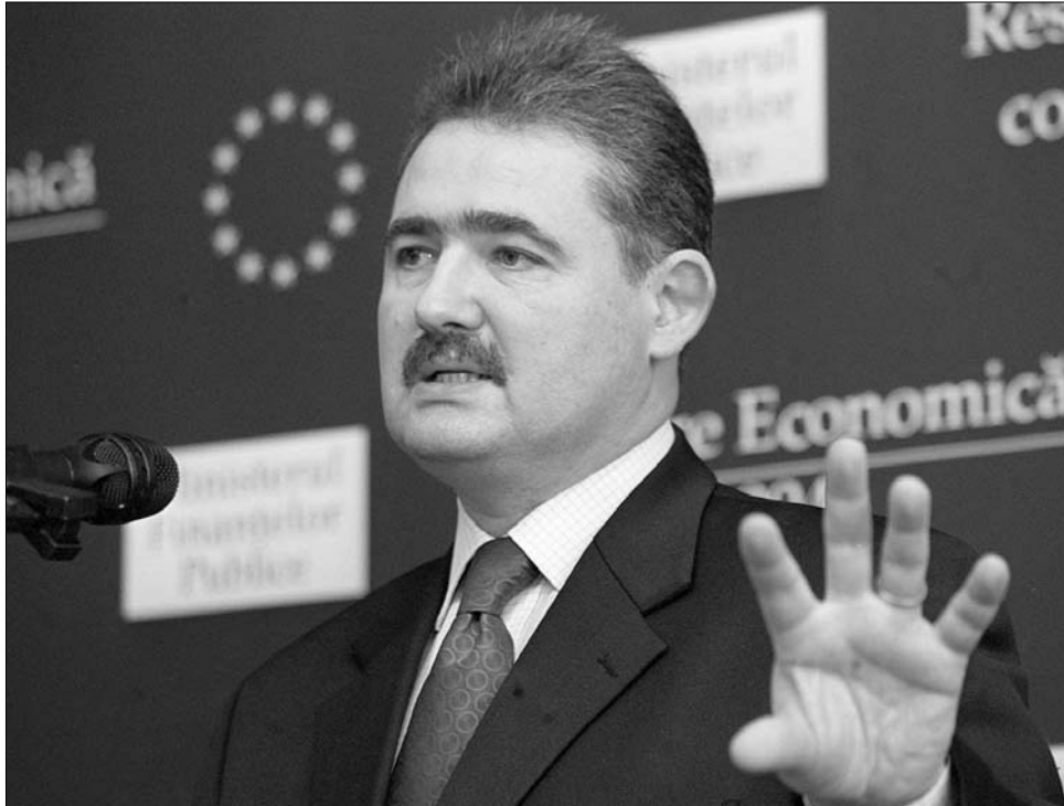
A kétéves áldozatnak pozitív eredménye lesz – nyugtató Mihai Tănăsescu, Románia IMF-képviselője

A szigorú karcsúsítási politika ugyanakkor még nem érhet véget, Jeffrey Franks, az IMF romániai küldöttségének vezetője rámutatott: a fiskális konszolidációt folytatni kell, különös tekintettel arra, hogy akadozik az uniós alapok lehívása, ráadásul a közkiadások egy része is alacsony határfokú intézkedésekre megy el. Franks szerint a március 30-án lezáruló kétéves kölcsönmegállapodás keretében Ro-