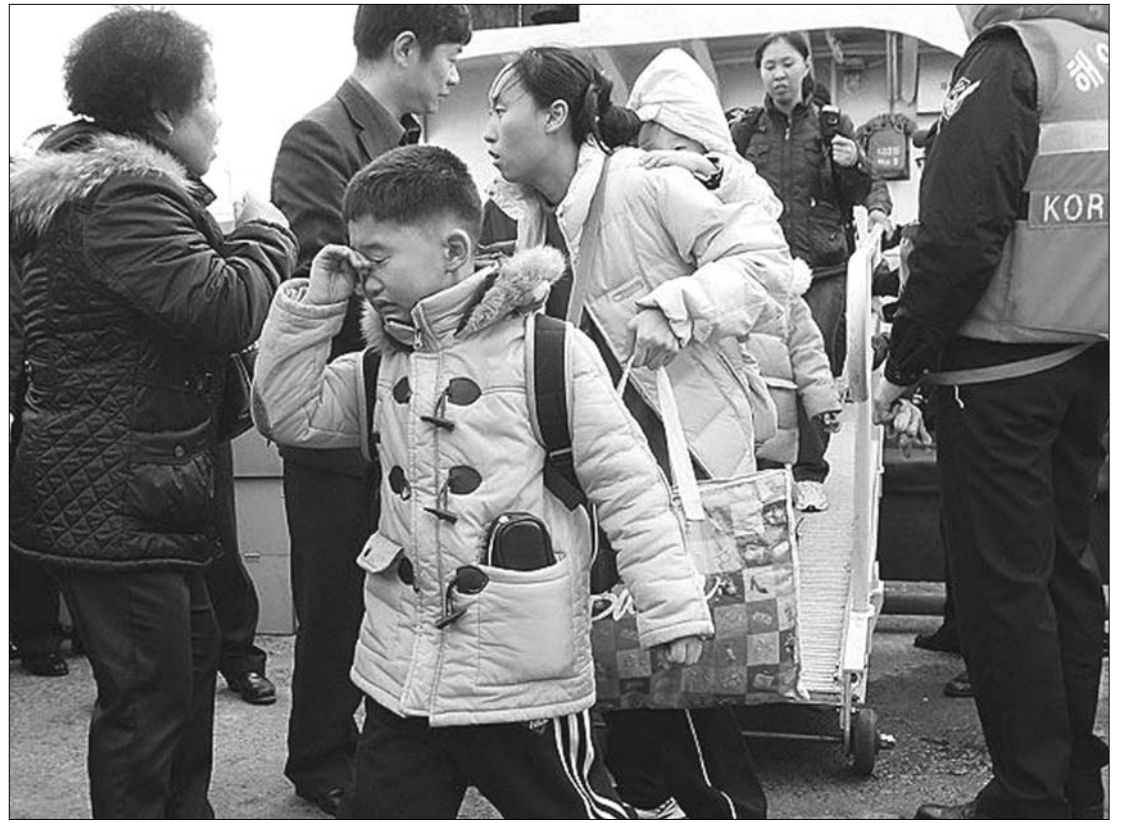
Összetörve és kialvatlanul. Egész családok menekülnek Dél-Koreában az északi országrész háborús fenyegetése miatt

Szöul elrendelte Jonpjong polgári lakosságának rendkívüli evakuálását. Phenjan ugyanis azzal vádolta meg Dél-Koreát, hogy „élő pajzsként” használja Észak ellen azokat a civil állampolgárokat, akik a minapi tüzérségi párbajban meghaltak a szigeten, ahol a dél-koreai katonai hatóságok szerint tegnap tüzérségi lövedékek zaja hallatszott. Nem sokkal később a rendkívüli evakuálási rendeletet a hatóságok hatályon kívül helyezték. A legújabb eseményekre azt követően került sor, hogy az Egyesült Államok és Dél-Korea tegnap reggel a Sárga-tengeren négy napos nagyszabású légi és haditengerészeti gyakorlatot kezdett. Észak-Korea a manővert túrhe-