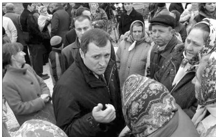
Vlad Filat moldovai miniszterelnök az államfői széket sem utasítaná vissza

Az országban másfél éve, a kommunisták 2009-es választási győzelme óta politikai-intézményi válság dúl. A vidéken népszerű párt 2001-ben került Moldova élére. 2009 áprilisában, újabb választási győzelmüket követően tiltakozáshullám söpört végig a 3,5 millió lakosú államon. A törvények értelmében, ha a képviselők képtelenek megválasztani az elnököt, akkor fél kell oszlatni a parlamentet. Ez azonban 2009-ben azért nem történt meg, mert a törvények azt is előírják, hogy évente csak egyszer kerülhet sor erre, s abban az évben egyszer már feloszlották a törvényhozást. ◀