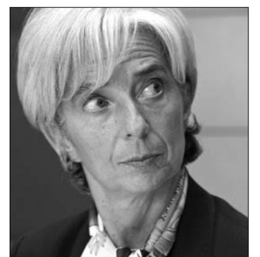
Christine Lagarde pénzügyminiszter

► Elkészült a megállapodás-tervezet a nemzetközi tárgyalóküldöttség és az ír kormány képviselői között Írország mintegy 85 milliárd euróval történő támogatásáról – közölte tegnap Christine Lagarde francia pénzügyminiszter. „A tervezet készen áll arra, hogy ma megvitassák és elfogadják” – mondta a politikusszónya. Az euróövezet pénzügyminisztereinek rendkívüli tanácskozása, amelyen az Írországnak nyújtandó 85 milliárd eurós támogatásról döntöttek, később kiegészült mind a 27 uniós tagország pénzügyminiszterével. Dublin az elmúlt hét végén folyamodott támogatásért az unióhoz, és a pénzügyminiszteri tanács meg is állapodott abban,