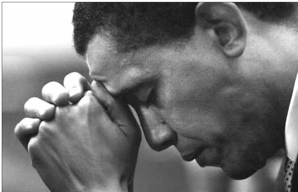
Barack Obama. Egy gondterhelt elnök

A republikánusok már hónapok óta követelik Obamától, hogy nyilvánosan is tisz-