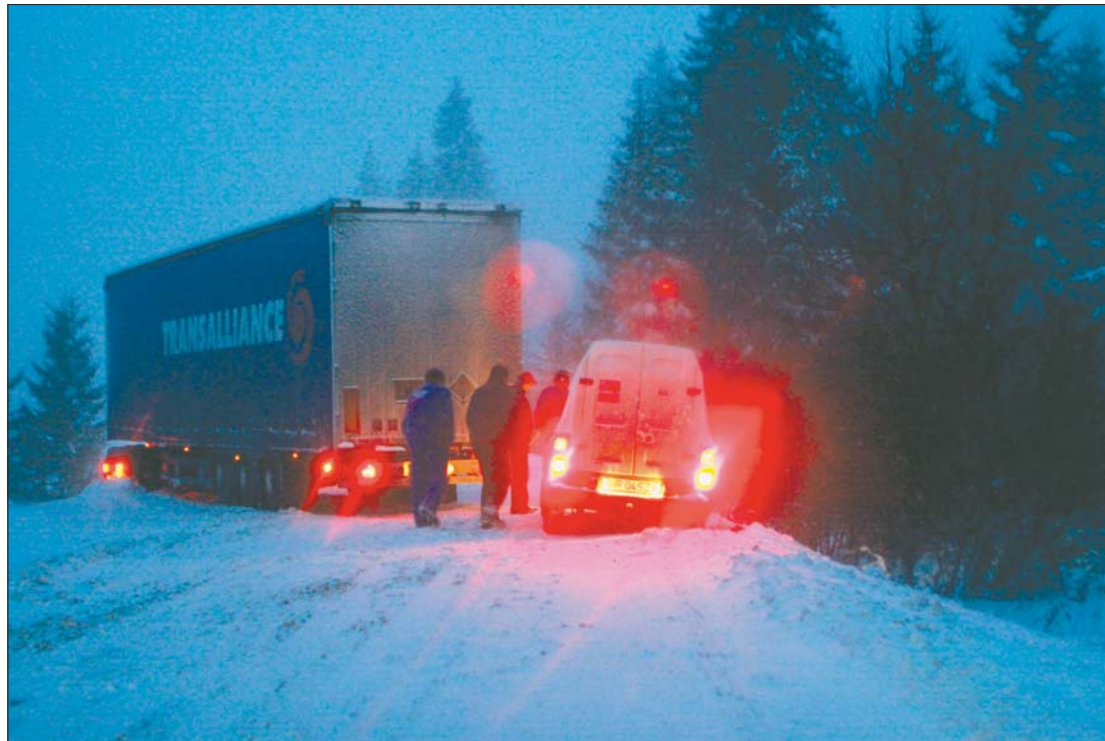
A szokatlanul meleg novemberi napok után mégis beköszöntött a tél a hónap utolsó hétvégéjén

a forgalom. A Meteorológiai Szolgálat enyhe felmelegedést jósol a következő napokra, a rendőrség szerint azonban továbbra is fontos a körültekintő, elővigyázatos közlekedés. 7. oldal ▶