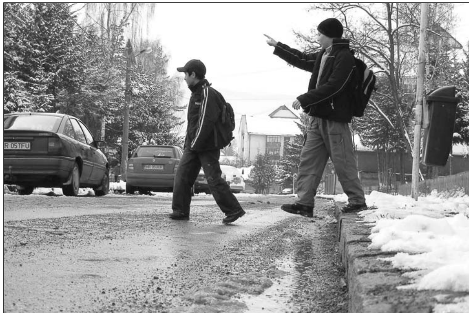
Mindig meglepetés... Ismét zavarba hozta a néhány centis hó a hazai hatóságokat

„Nálunk a cégnél különösen odafigyelnek arra, hogy minden előírásnak megfelelően az autó, nem csak azért, mert külföldön fokozottan ellenőrzik, hanem azért is, mert így nagyobb biztonsággal ér célba az áru” – számol be tapasztalatairól a kamionsofőr, aki Aradtól Csíkszeredáig hatszor esett át közúti ellenőrzésen. Mint mondja, súlyos baleseteket a hegyvi-