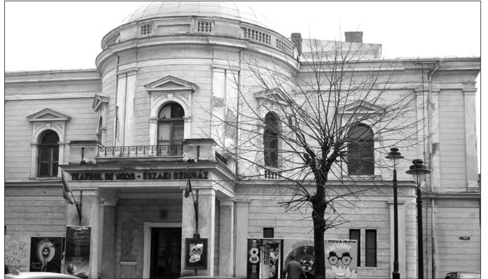
A nagyszínház épületének felújítása is hamarosan elkezdődik Szatmárnémetiben

A régi játékszínnek nem volt külön öltözője és mosdója, ezért csak rövidebb darabokat tudtak benne