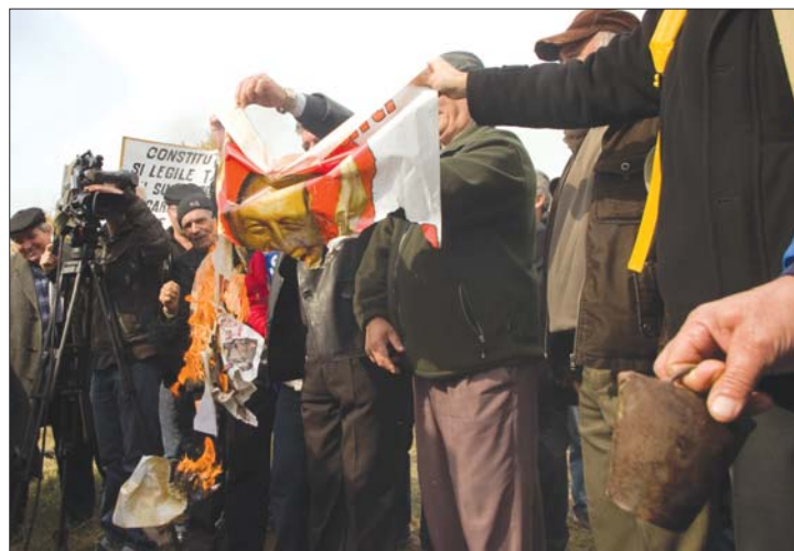
A tartalékos katonák Cotroceni előtt tiltakoztak. 3. oldal