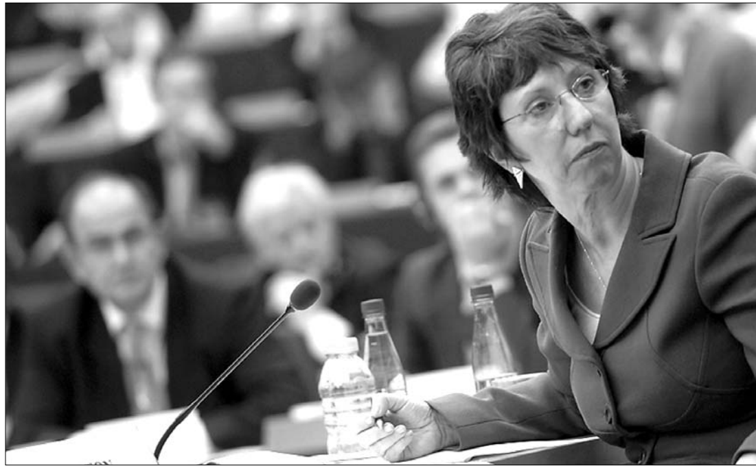
Catherine Ashton: az uniós szívesen biztosít helyet Brüsszelben a szerb-koszovói tárgyalásokhoz