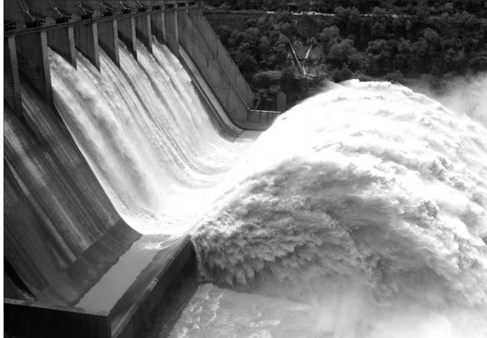
Dübörgő potenciál: a hazai alternatív energialevesítmények közül második legelterjedtebb a vízalapú