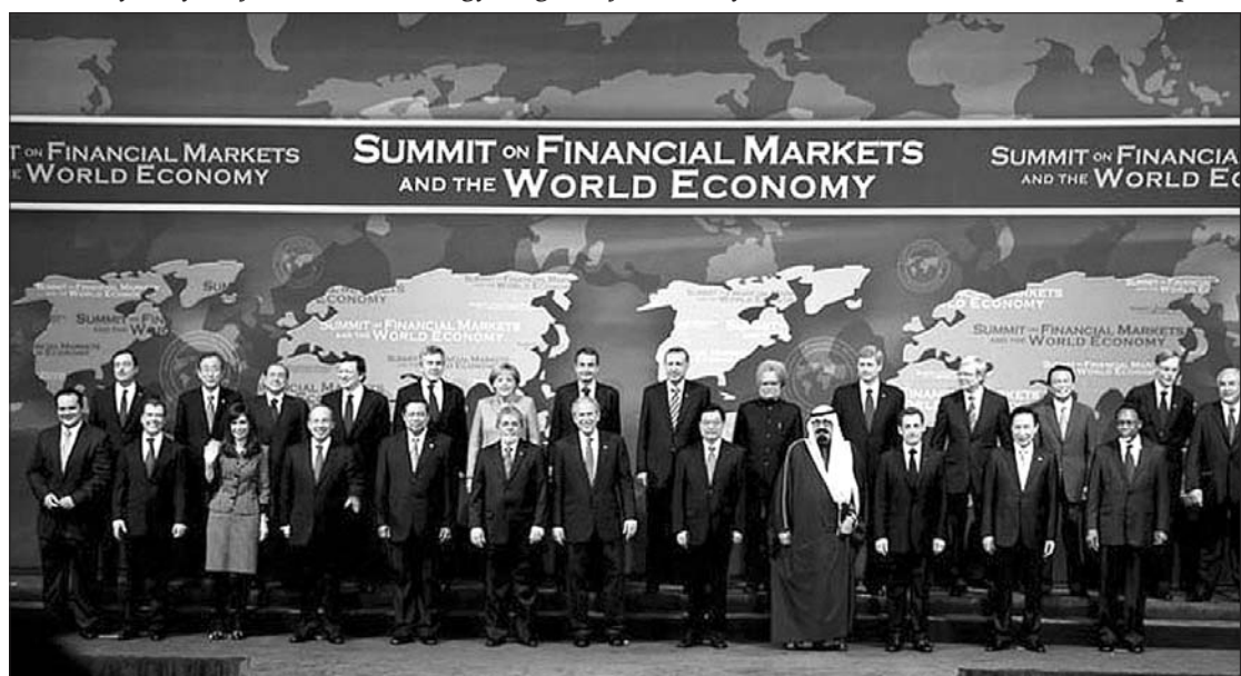
Bár mindenki saját országa érdekeit védte, mégis sikerült egyetértésre jutniuk a G20 csúcvezetőinek

Az amerikai javaslatok Kína mellett főként Németország részéről váltottak ki ellenállást: Rainer Brüderle német gazdasági miniszter – aki a megbetegedett német pénzügyminisztert, Wolfgang Schäublét helyettesítette a találkozón – ezzel kapcsolatban a tervgazdasági gondolkodás visszatérésére, valamint a növekvő nemzeti egoizmus veszélyére figyelmeztetett. Úgy vélte, hogy a javaslatokban foglaltak helyett inkább azokat a hibákat kell kiküszöbölni, amelyek az egyensúlytalanságokhoz vezettek. Berlin már régóta biztossá teszi, hogy Németország exportsikerei és kereskedelmi mérlegtöbblete nem az árfolyampolitika következménye, hanem a német cégek jobb versenyképességére vezethető vissza.