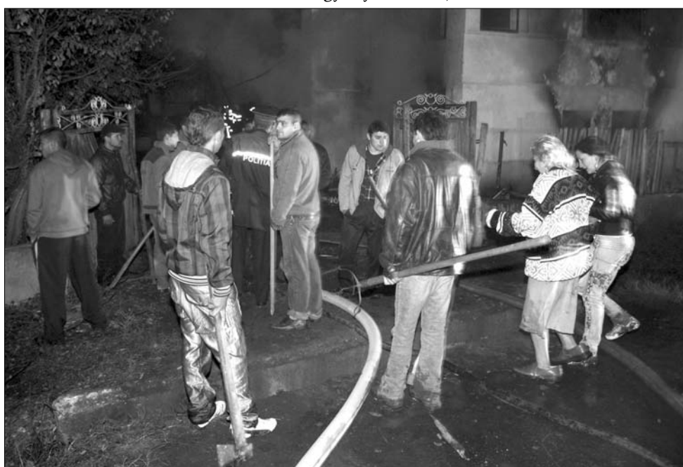
Gyűjtogatásba torkollottak a konfliktusok a Hargita megyei Recsenyében

xust akarunk, csupán méltányosságot” – mutat rá a tegnap nyilvánosságra hozott szakszervezeti kommunikáció. A bércsokkmentések miatt legedetlen alkalmazottak bíróságon támadják meg a fizetések mérsékléséről szóló határozatot, a túlóradíjak és a szünetnapok megvonását, valamint azt, hogy egy börtönőrre 50 százalékkal több fogva tartott jut az elbocsátások óta. A „börtönör-lázadáshoz” az is hozzájárult, hogy az utóbbi hónapokban kötelezővé tették a 13 óras, szünet nélküli szolgálatot az érintetteknek, ott is, ahol túlszűfoltak a börtönök, túlterheltek az örök. ◀