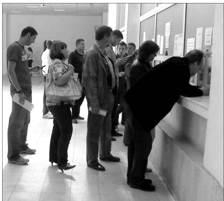
Fordulhat a kocka: bankárok állhatnak majd sorba, pénzintézetekért versengve

Mivel a hatalmasra hízott bankok miatt Európa pénzintézetei mára áttekinthetetlenek a nemzeti felügyelet számára, előbb-utóbb ismét a felszínre kerülhet valamilyen uniós szuperfelügyelet ötlete. Mint arról az Új Magyar Szó is beszámolt korábban, egy már jóvá is hagyta az Európai Parlament – a szervezet ellenőrzi és értékeli majd a pénzügyi rendszer egészének stabilitását fenyegető kockázatokat. Emellett három, megerősített jogkörű európai hatóság felügyeli a pénzügyi tevékenység egyes területeit: a bankokat, a biztosítási és a pénzügyi piacokat.