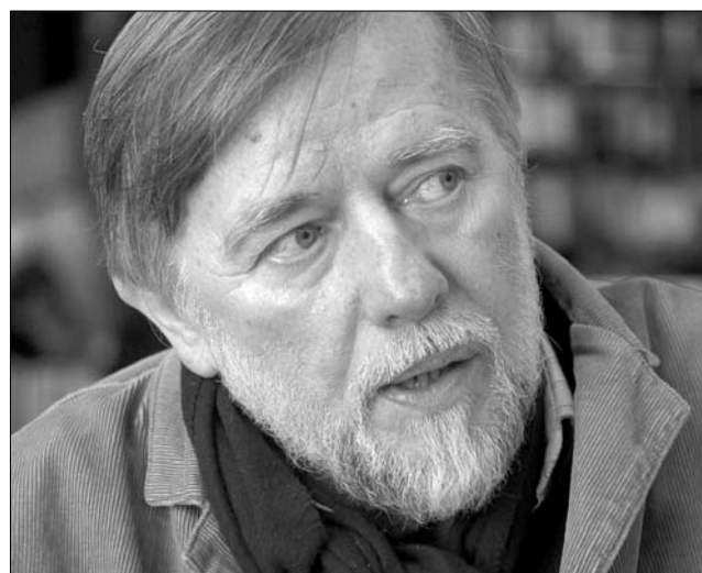
Tolnai Ottó a kortárs magyar irodalom jelentős alkotói közt jegyzik

évében, 1963-ban Zágrábba költözik, filozófiai tanulmányokat folytat. 1964-ben megjelenik az Új Symposion folyóirat, melynek 1974-ig szerkesztője. 1969–1972 között a folyóirat főszerkesztője. 1974–1994 között az Újvidéki Rádió művelődési műsorainak szerkesztője, képzőművészeti kritikusa. 1966-tól 1990-ig a Jugoszláv Írószövetség tagja. A szövetségnek, amely az államilakulattal egyidőben felbomlott, ő volt utolsó elnöke. 1990-től a Magyar Írószövetség tagja, 1992-től a Veszprémben megjelenő Ex Symposion főszerkesztője. Főbb díjai: a hollandiai Mikes Kelemen Kör díja (1988), József Attila-díj (1991), a Kortárs nívódíja (1992), Az Év Könyve jutalom (1992), Füst Milán-díj (1997), Magyar Irodalmi Díj (2005), Kossuth-díj (2007). ◀