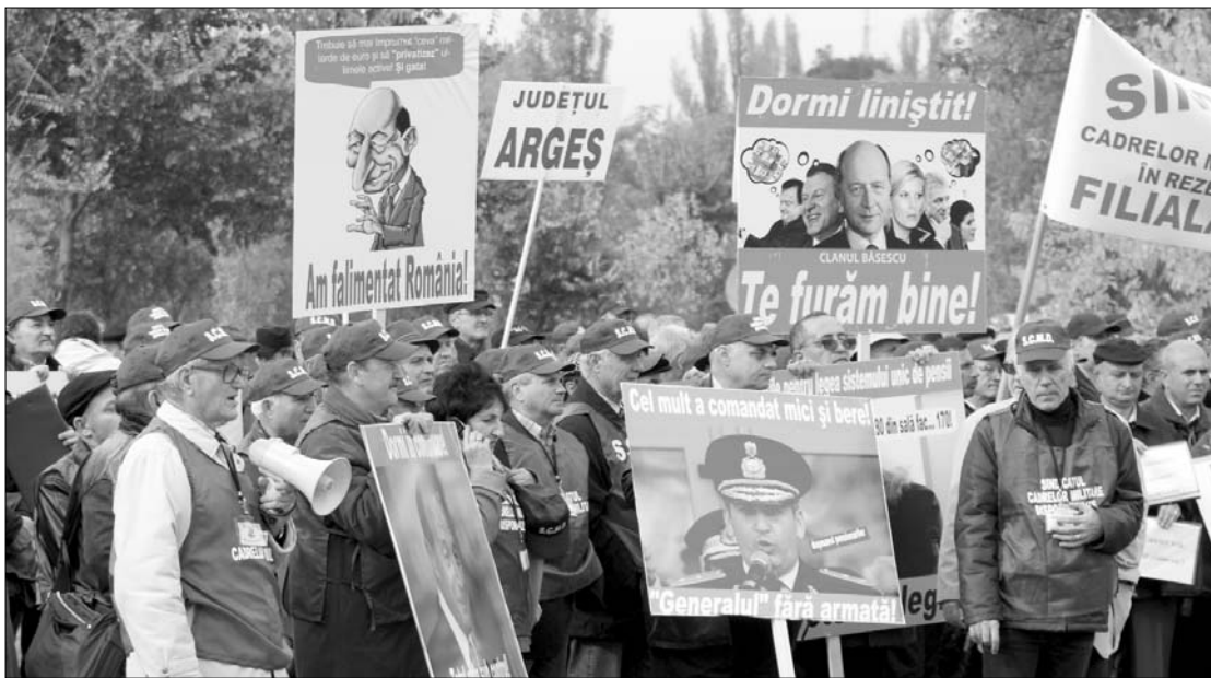
A tartalékos és nyugdíjas katonák tegnap a Cotroceni-palota előtt „álltak hadrendbe”

Az új nyugdíjtörvényt a parlamentnek a Nemzetközi Valutaalap (IMF) kérésére kell elfogadnia, ugyanis Bukarest az IMF szervezésében tavaly kötött többoldalú nemzetközi hitelcsomag fejében vállalta a nyugdíjrendszer megreformálását. A jogsza-