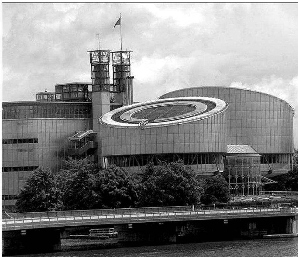
Strasbourg. Az Európai Emberjogi Bíróság épületegyüttese

A testület döntései nem egy esetben gyökeresen megváltoztatták a romániai jogszabályok egy-egy kitételét, így például az előzetes letartóztatással, a telefonlehallgatással, a tulajdonjoggal kapcsolatos rendelkezéseket. ◀