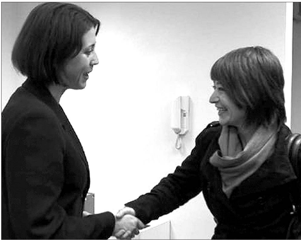
A pénz hatásos motivációs eszköz, ám távolról sem az egyetlen teljesítményösztönző

Ha választ szeretnénk kapni arra, mi is tulajdonképpen a valódi motiváció, meg kell különböztetnünk két típusát: a külső- illetve a belső indítást. A külső motiváció esetén a teljesítmény elérését célzó jutalmat egy külső fél határozza meg, ide tartoznak az anyagi és szociális ösztönzők, mint például a fizetés vagy jutalom. Itt nagyon fontos, hogy a fogadó fél hogyan értékeli a jutalmat, mert ez akár ellentétes hatást is kiválthat. Demotiváltsághoz vezethet például, ha a munkavállaló nem tartja elegendőnek vagy megszokta a magasabb bért