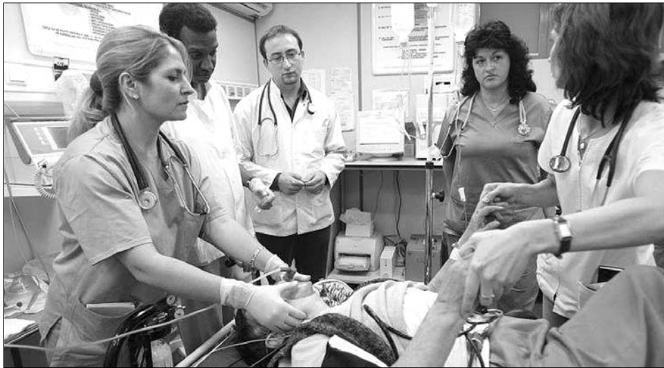
Sok orvos közt elvész a beteg, ha nem fizet – vélik a hazai páciensek