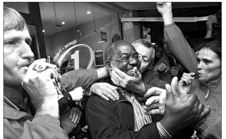
A ghánai származású orvos 51,4 százalékkal győzte le ellenfelét

zi” – mondta Bossman, aki az előző ciklusban már tagja volt az önkormányzatnak képviselőként. Bossman 33 éve érkezett a volt jugoszláv köztársaságban, hogy orvosi tanulmányokat folytasson. Bár haza akart térni, szándékát megváltoztatta, miután egy horvát származású diáktársát vette feleségül. Több mint húsz éve él a festői szépségű Piranban, ahol az emberek „nem fekete bőrű orvosként vagy külföldiként, hanem egy jó emberként” tekintenek rá. Szlovéniában vasárnap tartották az önkormányzati választások második fordulóját. A választási részvétel 41 százalék volt. ◀