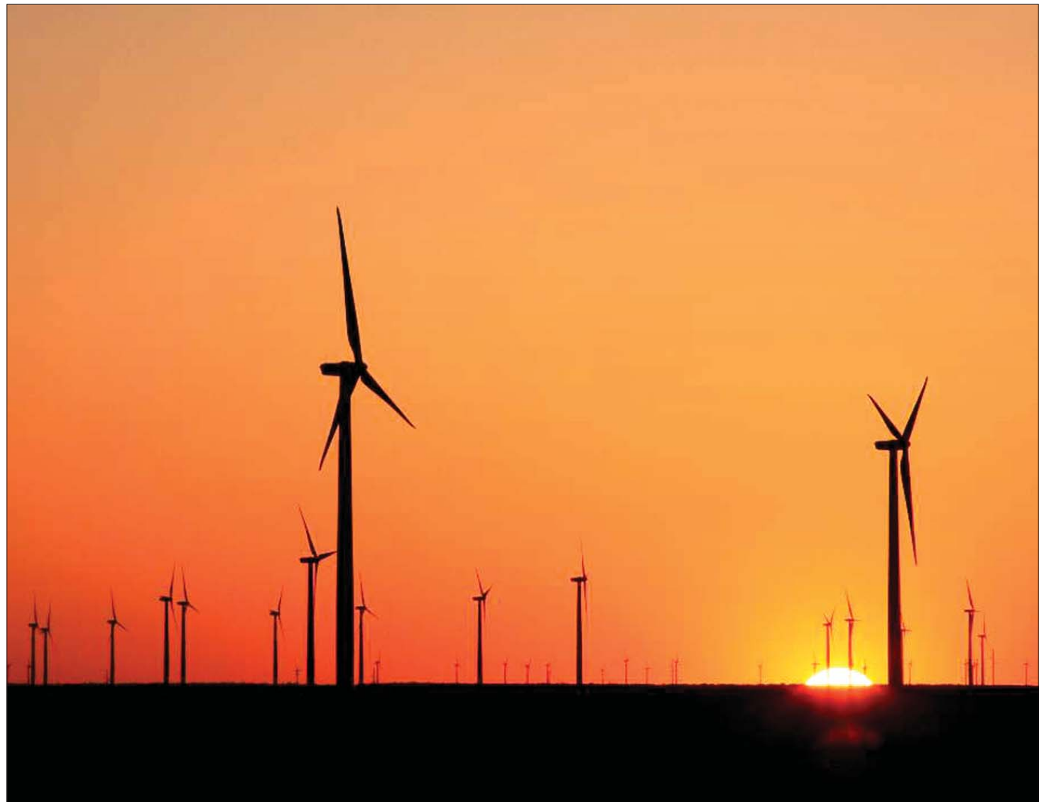
Aranyló horizontok: Romániának óriási energetikai potenciálja rejtőzik a szélmalomparkokban

Az ambiciózus állami támogatás ellenére is drága marad az alternatív energia