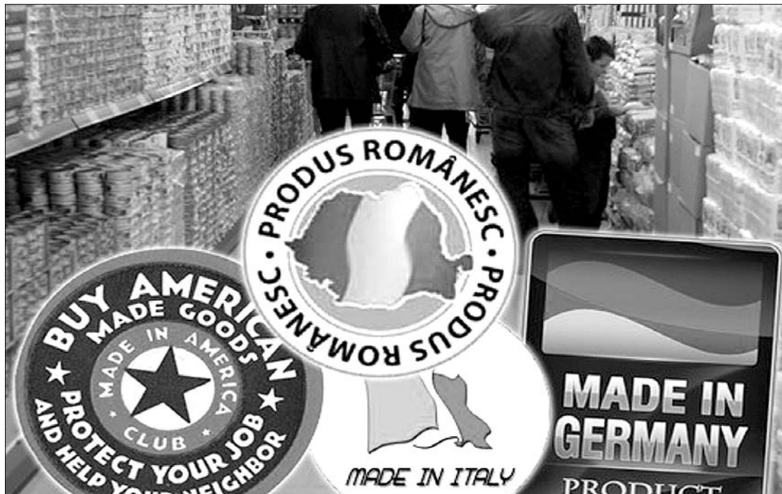
Úgy tűnik, a „márkák harca” nemcsak a gyártók, de az érdekvédelmi szervezetek között is felütötte fejét