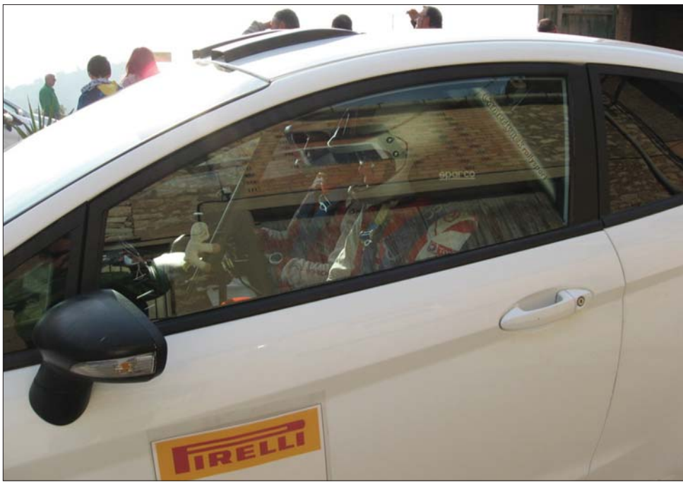
Cosma murván és aszfalton is „meglovagolta” a rendelkezésére bocsátott Ford Fiesta R2-t