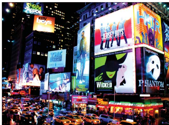
A reklámfény sokoldalú üzenethordozó: nemcsak világit, árulkodik is