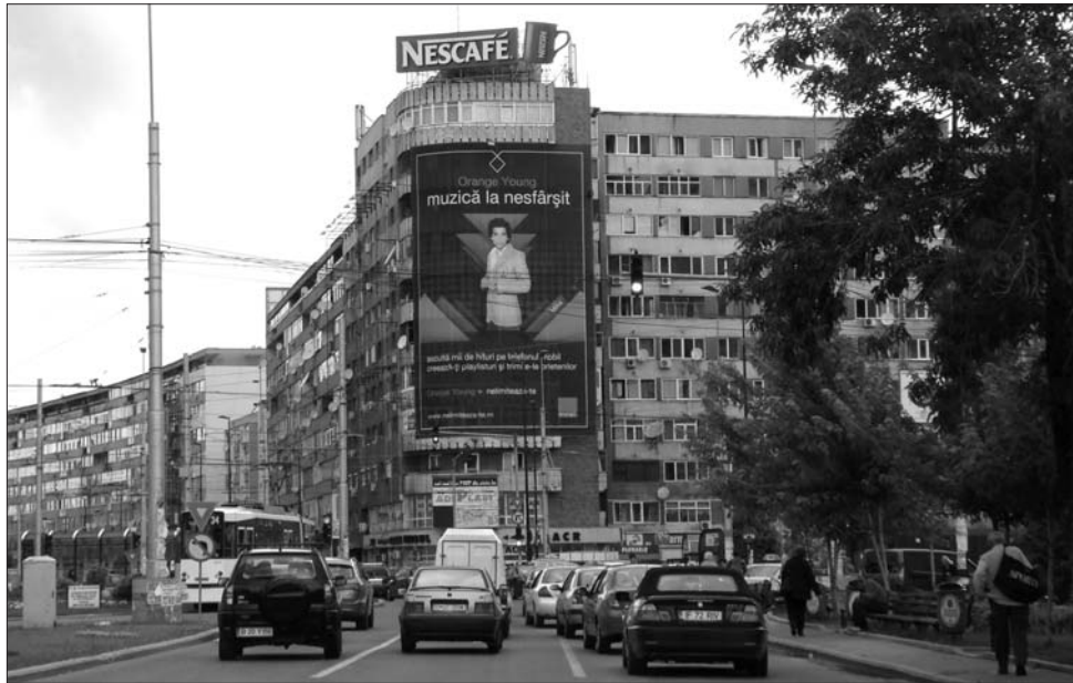
Míg a válság a kreativitás romlását hozta, a hirdetői ma többet várnak el pénzükért, mint korábban

Kérdésünkre, hogy számításaik szerint mikorra térhet vissza az aranykor, Szabados pesszimista választ ad: „Soha nem érjük el a két évvel ezelőtti szintet. De talán jobb is így, mert pazarlás volt az, ami akkor végbement. Egyesek négy-öt hónapra elegendő tartalékokat halmoztak fel, amit elméletileg nem is használtak volna fel, ha nem következne be a recesszió”. A piac helyrebillenése Szabados szerint „optimizmus esetén is csak jövő év végére várható, de talán realisabb a 2012-es változat”. Az igazgató szerint azonban, ha előrehozott választások lesznek Romániában, hamarabb is bekövetkezhet a fellendülés. „Magyarországgal ellentétben, ahol a legutóbbi választások csupán 10-12 százalékkal lendítettek a piacon, nálunk nagyszámúval jobban a helyzet” – hangsúlyozza Szabados Attila.