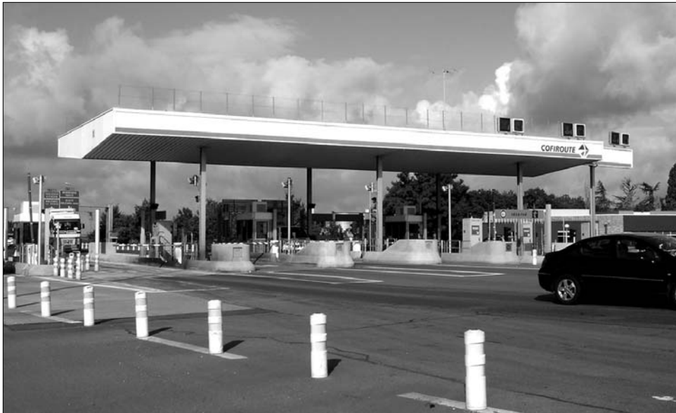
Még nem tudni, hogy a sztrádadíjat beléptető rendszerrel szedik-e majd be Romániában

Autópályadíj bevezetésére készül a kormány – erősítette meg tegnap a szállítási miniszter. Anca Boagiu nem szolgált részletekkel arról, mikortól és milyen formában kéri majd a sztrádashasználati díjat a gépkocsivezetőktől, illetve mekkora lesz az összege. Az Europa FM rádió az illeték bevezetését az Európai Bizottság kérte. Tájékoztatása szerint Brüsszel biztos akar lenni abban, hogy lesz pénz azoknak az autópályáknak a karbantartására, amelyek a következő években uniós pénzekből épülnek majd Romániában. „Az operatív programok révén 373 kilométer autópálya épül a jövőben az országban. Azt már most tudjuk, hogy nem lesz pénzünk a karbantartására, ha nem vezetjük be a sztrádadíjat. Nem örülünk neki, de így jártak el más uniós államok is” – magyarázta a miniszter. A Mediafax hírügynökség a hétfőn szivárogtatta ki az autópályadíj bevezetéséről szóló tervezetet. A dokumentumot – amelyről várhatóan holnap ülésein tárgyal a kormány – a szállítási és a pénzügyminisztérium dolgozta ki.