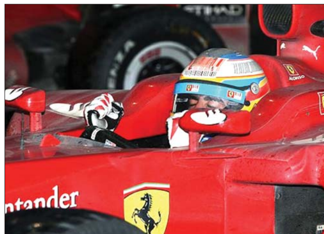
Fernando Alonso közelebb került egy újabb megkoronázáshoz

Brazil Nagydíjon, és egy héttel később, a Yas Marinán, az Abu-Dzabi Nagydíjon is. Alonso huszárós hajrában van, 90 pontot gyűjtött a legutóbbi négy futamon és sokan máris megelőgezik neki harmadik világbajnoki címét. A spanyol 231 pontjával szemben az ausztrál Mark Webber (Red Bull) 220-at, a brit Lewis Hamilton (McLaren) 210-et, a német Sebastian Vettel (RBR) 206-ot, a címvédő Jenson Button (McLaren) pedig 189-et tud felmutatni, ami azt sejteti, hogy óvatos versenyzéssel Alonso össze tudja szedni az elsőséghez szükséges pontokat.