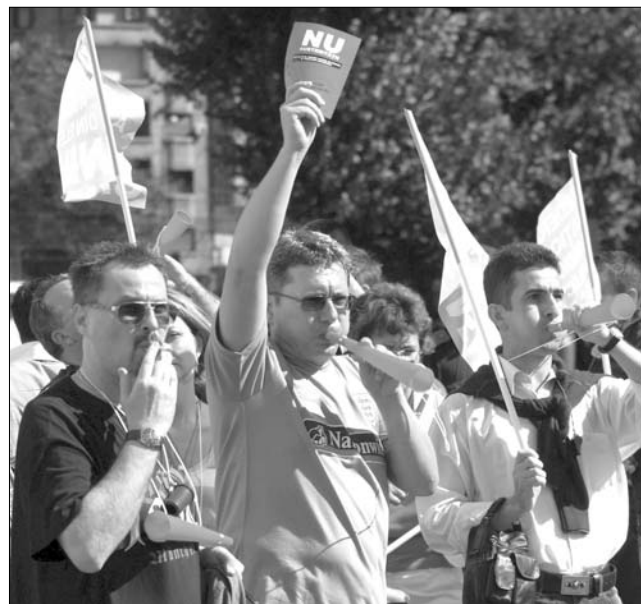
A tüntetések is a bérek helyreállításáról szólnak

Az IMF küldöttsége tegnap a Román Nemzeti Bank (BNR) képviselőivel is tárgyalt. A BNR név nélküli illetékesei a hotnews.ro-nak elmondták, a delegáció „rendkívül elégedetten” távozott a találkozóról. „Gratuláltak azért, ahogyan a jegybank korbában tudta tartani az árfolyamot” – mondta az illetékes. A tárgyalások után Franks emlékeztetett, hogy az IMF következő hitelrészlete a BNR valutatar-talékait fogja növelni. ◀