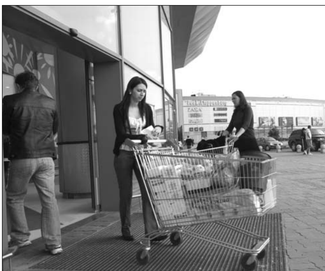
Egyre kevesebb hazai céget „táplál” az élelmiszerpiac

Nemcsak a kereslet, a gyártás is jelentősen visszaesett a hazai élelmiszeripari termékek, illetve italok piacán. A Romániában jelen levő multinacionális cégek mintegy huszonöt nagy gyáregység bezárása vagy áttelepítése mellett döntöttek az utóbbi öt évben – melynek következtében háromezer dolgozó vesztette el állását. A termelést jobb esetben az országon belüli gyáregységek vették át, de gyakori volt a produkció külföldre való áttelepítése is. A leg-