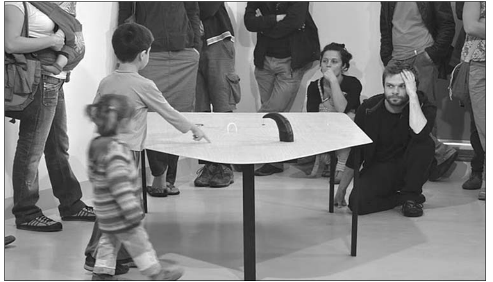
Nyitott, előítéletmentes befogadói magatartást kérnek a kortárs alkotások

Hangoknak, képeknek és tárgyaknak véletlenszerű ta-