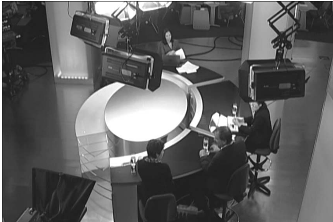
Az egyik legnagyobb hazai sajtóbirodalomban, a Realitatea Mediában a fizetések már több hónapja késnek

Az alkalmazottak helyzete foglalkoztatja már a Mediasinet is. Az újságíró szakszervezet tegnap felszólította a cég vezetőségét, „vegye végre emberszámba” a sajtósokat. A Mediasind közleményében úgy fogalmaz: a Realitatea-nál uralkodó állapotok már a sajtószabadságot veszélyeztetik. A szakszervezet úgy tudja: a bérek 2-3 hóna pos késését a cégvezetés azzal tetézi, hogy a munkaszerződéseket felbontására kötelezi az alkalmazottakat, akiket ezentúl csak cikkdíjban hajlandó fizetni. A Mediasind információi szerint a tröszt már hónapok óta nem fizeti a túlórákat és a szabadnapokat sem.