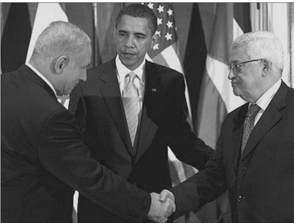
Egy éve történt. A szereplők ma is ugyanazok: Netanjahu, Obama, Abbász

A megbeszélések kimeneletét illetően óvatos derűlátásra ad okot, hogy a Háárec című napilap internetes kiadásának adott nyilatkozatában Ehud Barak izraeli védelmi miniszter közölte: országa kész átengedni a palesztinoknak Jeruzsálem egyes részeit a béketárgyalások keretében; a város arabok lakta negyedei a majdani palesztin államhoz fognak tartozni. A mindkét fél (vallás) számára szent helyeket egy „különleges hatóság” fogja igazgatni – tette hozzá. Benjamin Netanjahu izraeli