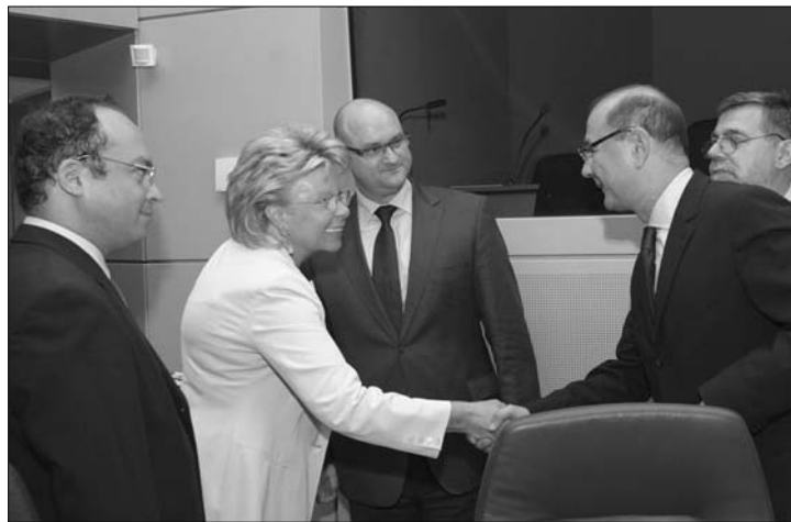
A Bogdan Aurescu (balra) vezette román küldöttséget fogadta Viviane Reding

Brüsszeli beszámolókat szerint Bogdan Aurescu statisztikai adatokkal cáfolta azt a francia érvet, hogy a Franciaországban élő romániai romák fenyegetik a közbiztonságot és ezért van szükség a kitoloncolásukra. Eszerint tavaly összesen 708 román állampolgárt tartottak fogva francia börtönökben, a szám