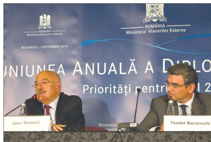
Újrázás Bukarestben. Martonyi János és Teodor Baconschi

▶ Egy hónapon belül másodszor látogatott Bukarestbe a magyar külügyminiszter. Martonyi ezúttal a hagyományos román díszmeghívottjaként. 3. oldal ▶