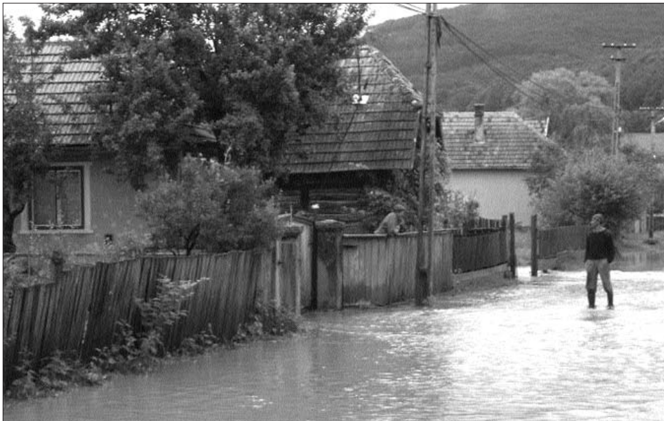
A hazai hatóságok dolgát nehezíti, hogy a házak egy része árterületekre épült

Egyelőre sürgősségi kormányhatározat révén támogatáshoz jutottak azok a területek, amelyeket a nyáron katasztrófa sújtott. Így 25 millió lejes támogatást kapott Săucești – ezen a bákói településen kétszer is munkálatakat tett Traian Bănescu államfő, a falu helyzetét fokozott figyelemmel kísérte a sajtó. Negyvenmillió lejes támogatást kapott Neamț megye, Doljești-Rotunda környéke – itt Dávid Csaba tájékoztatása szerint nemcsak az árvízvédelmi rendszerek újratervezése, de a kivitelezés is folyamatban van. Százmillió lej jutott Hargita és Kovászna megyének, itt még csak a tervezésnél tartanak az illetékesek, de a vízügyi szakemberek, de a vízügyi szakemberek arra hívták a figyelmet: ha a tervek elkészülnek, há-