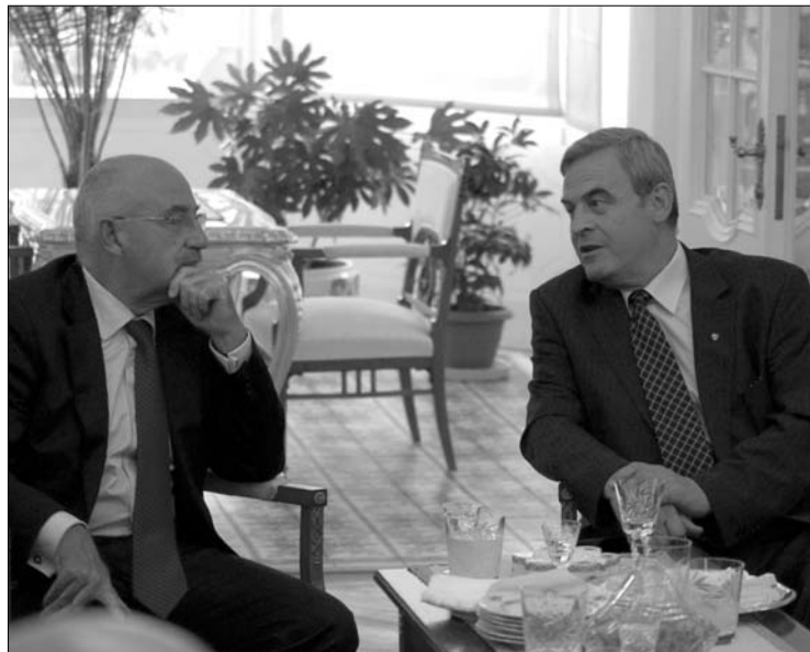
Martonyi János Tőkés Lászlóval a bukaresti nagyköveti rezidencián, Markó Bélával a kormányánál tárgyalt

Martonyi egyébként lapzártánk előtt Basescuvall is találkozott. ►