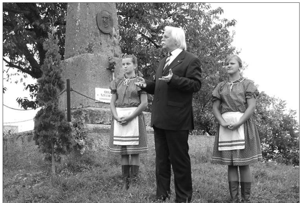
Fél évszázados a „legnagyobb magyarnak” állított kőszegremetei emlékoszlop

az egyik első köztéri emlékoszlopa a nagy reformátor-nak. Avatásán a környező települések román lakosai is olyan jól érezték magukat, hogy a krónika szerint kalapból itták a bort. A szobornak nevezett emlékmű azóta is áll, hiába próbálta kétszer is eltüntetni az új országtulajdonosok nacionalizmusa. Már hosszabb ideje itt tartják a nemzeti jellegű ünnepségeket a remeteiek, s minden szeptember első szombatján külön emlékeznek Széchenyi grófra. ◀