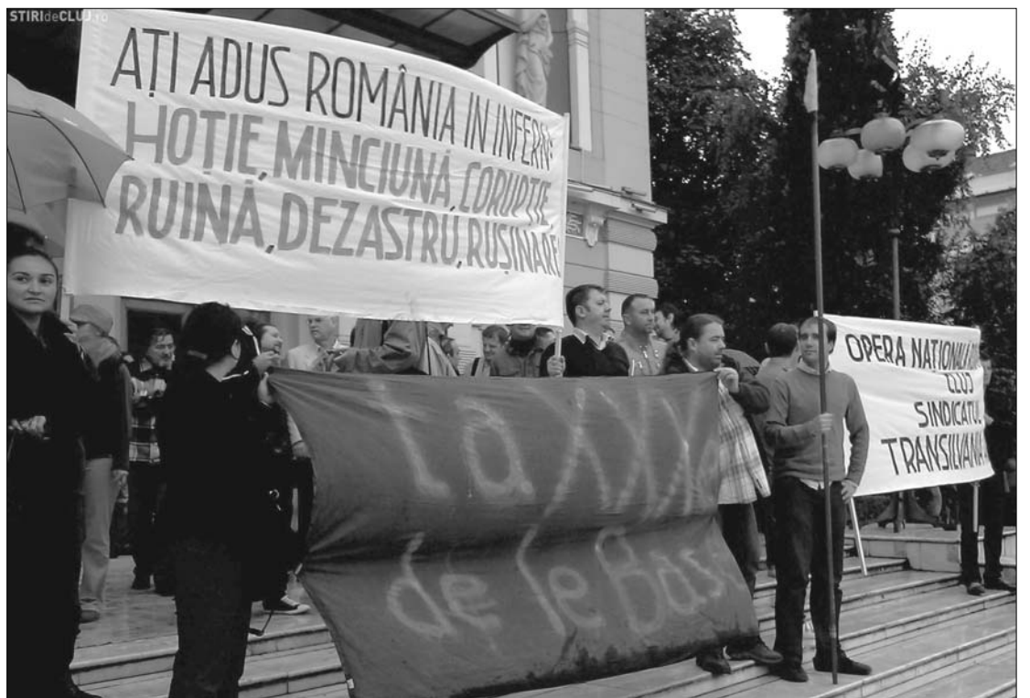
„Pokolra juttattátok Romániát” – üzenték a kormánynak az Emil Boc kormányfőt „hazakövetelő” kolozsváriak